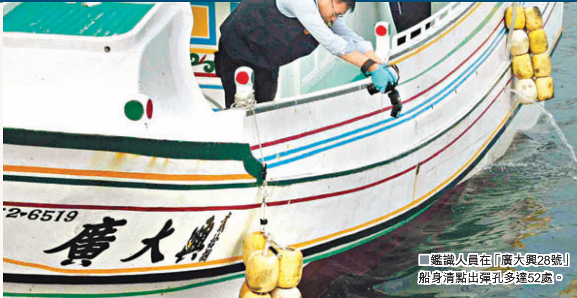
■鑑識人員在「廣大興28號」船身清點出彈孔多達52處。