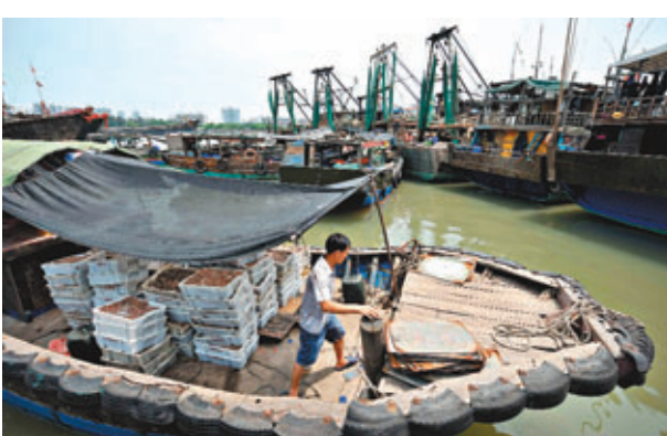
■南海進入伏季休漁期。5月16日，休漁船隻在海口新港碼頭卸下最後一船漁獲。

據了解，中國南海海域實施休漁制度已14年，通過科學制度，南海近海資源從質量和數量上均有所恢復，休漁工作取得良好成效。