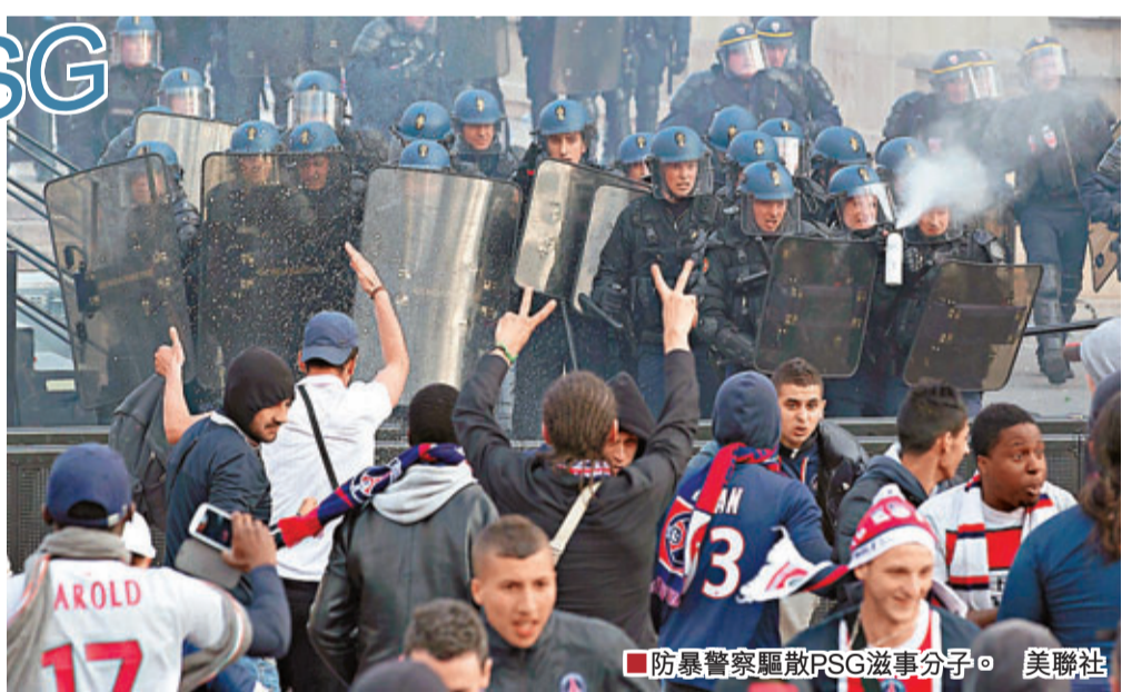
防暴警察驅散PSG滋事分子。

巴黎聖日耳門(PSG)時隔19年再度獲得法甲聯賽冠軍，昨晨在巴黎人權廣場舉行儀式，向PSG頒獎盃，但慶祝活動卻變成騷亂，有球迷在人群中燃起煙火棒，有人更衝破圍欄爬上現場台上。慶祝活動歷時1小時開始，但騷亂仍繼續，並蔓延附近埃菲爾鐵塔等地，以致活動5分鐘後便草草收場。部分球迷與防暴警察發生衝突，警方最終要施放催淚彈。巴黎警方表示，騷亂共造成30人受傷，另有21人被捕。