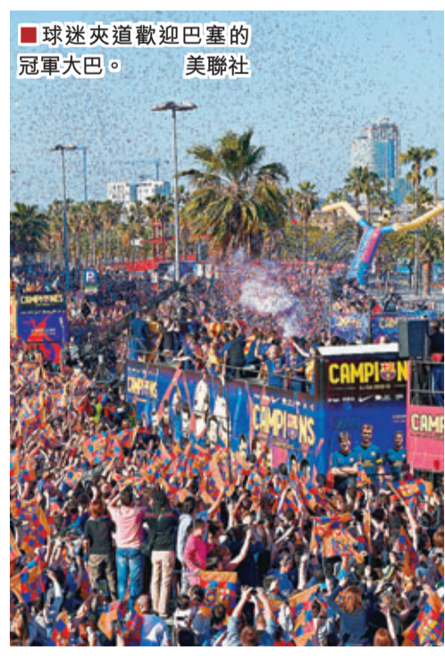
球迷夾道歡迎巴塞的冠軍大巴。