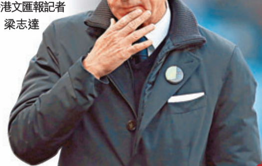
香港文匯報記者 梁志達