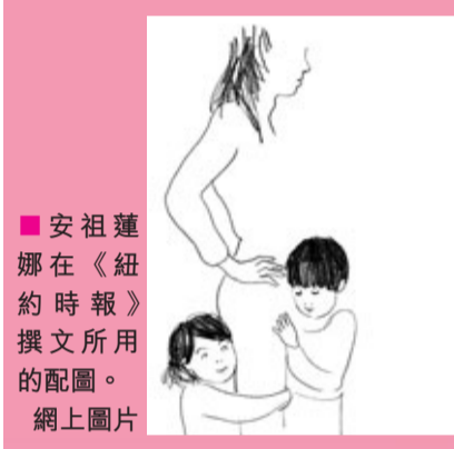
安祖蓮娜在《紐約時報》撰文所用的配圖。網上圖片