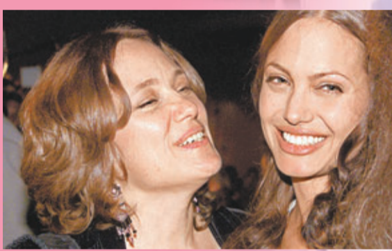
右起：安祖蓮娜和母親一向感情好。