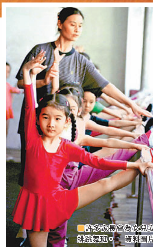
■許多家長會為女兒安排跳舞班。 資料圖片