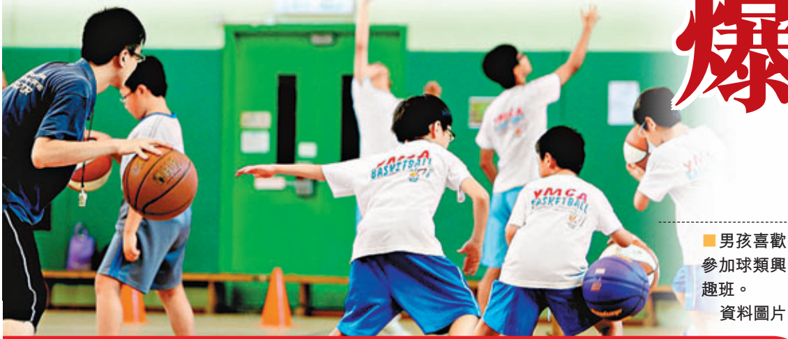
■男孩喜歡 參加球類興趣班。 資料圖片

作者簡介： 胡潔人博士 現任香港城市大學專上學院社會科學學部講師。2009年獲得香港中文大學社會學系哲學博士。中國人民大學糾紛解決研究中心成員、中國奧斯特羅姆協會(Ostrom Society)會員、香港作家協會會員。發表中英文論文數篇。