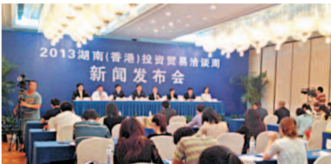
湖南省政府在新聞發布會上公佈,2013年湖南(香港)投資貿易洽談周將於6月17至21日在香港舉行。

際影響力的港澳客商、政要以及世界500強企業全球高管,主會場設在香港,大部分市州招商活動在廣州、深圳等珠三角地區。