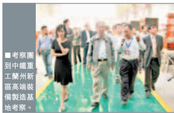
考察團到蘭州新區考察

據了解,目前,香港已成為甘肅第一大投資來源地,累計在甘肅投資項目逾1,000個,涉及礦業開發、風力發電、石化、房地產、城市供水、服務業等多個領域,合同港資金額達到21億美元。