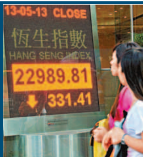
■港股低開後跌勢轉急,收跌331點,失守23,000點大關,成交596億元。 中通社

多達43隻藍籌向下,匯控(0005)升轉跌0.57%至87.55元。中資金融股亦拖低大市,平保(2318)旗下內地的