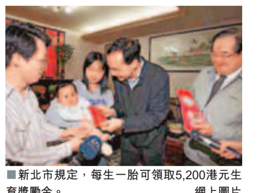
■新北市規定，每生一胎可領取5,200港元元生育獎勵金。

台北生育獎金達高雄三倍 香港文匯報訊 據台灣《聯合報》報導，為鼓勵生育，不論五都或偏鄉都提供生育獎勵金；但台灣「一網多本」，有的縣市規定父或母要設籍滿1年、有的只要設籍6個月，還有縣市規定必須「合法婚姻」才能領取獎勵金。依據各縣市的財政狀況，獎勵金就會有貧富差距。同樣是五都直轄市，獎金高低差很多；台北市的生育獎勵金是高雄市、台南市的三倍多。 依據台北市和新北市的規定，每位媽媽皆可領取2萬元(新台幣，下同)(約5,200港元)生育獎勵金；台中市媽媽可領1萬元(約2,600港元)；但台南市和高雄市媽媽僅有6,000元(約1,560港元)。 設籍規定各異 未婚媽媽可領 此外，各縣市對設籍的規定也不同。例如，台南市只要設籍滿6個月即可，未婚媽媽也可領，是全島最低門檻；但台北市必須設籍且實際居住達1年以上，才可請領獎勵金。 即將升格為第六都的桃園縣最複雜，縣內各鄉鎮市的規定門檻和獎勵金都不一樣，像新屋鄉的生育獎勵金為3,000元(約780港元)，復興鄉則可高達12,000元(約3,120港元)；還有鄉鎮市規定，外籍媽媽必須證明與本鄉鎮市民結婚且居住滿6個月以上，才可領取生育獎勵金。