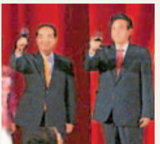
■2008年陳雲林(右)和宋楚瑜在宴會上祝酒。

香港文匯報訊 據中新網及中央社報導，台灣親民黨副秘書長劉文雄日前指出，親民黨主席宋楚瑜在內湖宴請前海協會會長陳雲林等一行人，強調兩岸和平發展原則，堅持反對「台獨」立場。