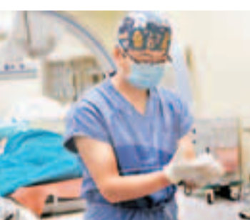
護士缺口仍然巨大，未能滿足臨床需要。

香港文匯報訊(記者 楊毅 重慶報導)重慶市衛生局日前發佈消息稱，目前全市有7萬餘名註冊護士，較2005年增長了50%以上，但缺口仍然巨大，不能滿足臨床需要。為此，重慶將建10個基地培訓專科護士，改善護士緊缺局面。