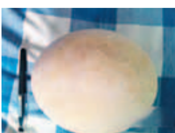
駝鳥蛋化石。

香港文匯報訊(記者 蘭超 內蒙古報導)內蒙古巴彥淖爾市烏拉特前旗一施工現場出土一批駝鳥蛋化石，其中6枚遭哄搶，經警方全力追繳，截至12日已悉數追回。目前，此案還在進一步審理中。