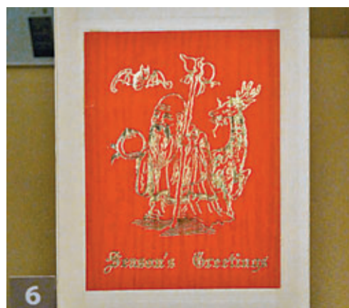
■孫科使用的賀年卡