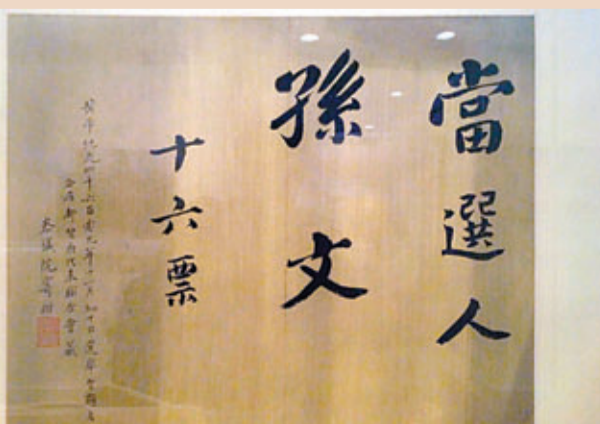
■孫中山的《當選證書》

得全票。據歷史記載，這一票投給了革命黨人的軍事幹才、華興會首領黃興。今日社會，選舉未獲得全票實屬正常，且孫中山在十七票中得到十六票，已經是極高的得票率。但是回到那個時代。在南方代表們選舉大總統的時候，中國的北方還處在清王朝的統治之下。宣統皇帝還沒有退位。在皇權專制的年代，皇權被神秘化、崇拜化為萬民擁戴的神話，成為統治合法性的來源之一。黎民百姓，沒有人敢說自己反對君王，否則，就是滅九族的十惡大罪。然而，為着建立共和國家的革命黨人，已經完全走出了舊時代的陰影，他們用這張《當選證書》來昭示新時代的意義。