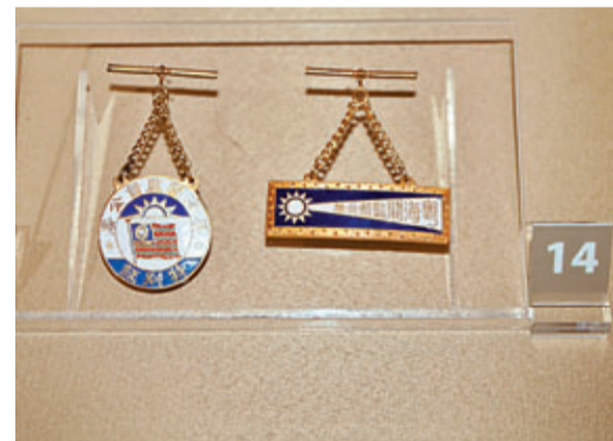
■孫中山女婿戴恩賽使用的海關通行證