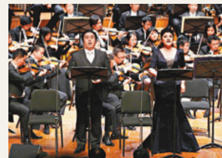
■國家交響樂團前晚在京上演《大地安魂曲》紀念汶川地震五周年。 本報北京傳真

香港文匯報訊（記者 鞏璋 北京報道）為紀念汶川大地震五周年，11日晚，中國國家交響樂團由首席指揮米歇爾·普拉松執棒，在國家大劇院上演了樂團團長關峽的作品《大地安魂曲》。演出當天，由維京唱片錄製發行的《大地安魂曲》唱片國際版首發。