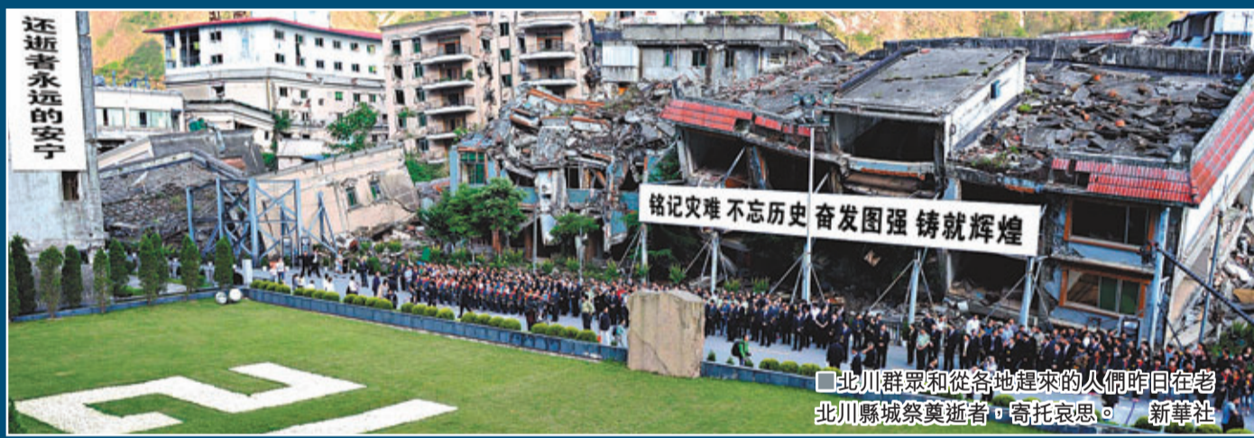
■北川群眾和從各地趕來的人們昨日在北川縣城祭奠逝者，寄托哀思。