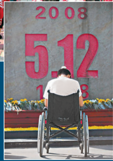
■一名在汶川地震中失去雙腿的年輕人昨日在北川老縣城的紀念碑前祭奠地震遇難者。