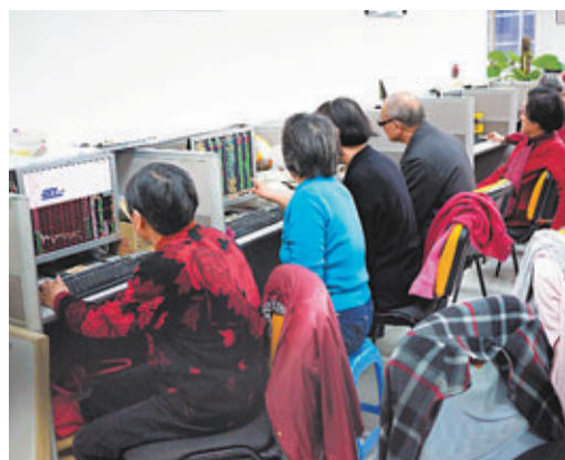
■湘財證券泰興路營業部內，看行情的股民。