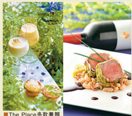
■The Place多款養顏燕窩甜品

今天就是母親節了，大家買了母親節禮物嗎？想與媽媽在哪兒吃頓母親節飯？這兒有部分選擇，希望大家於這個溫馨滿溢的佳節向媽媽表達愛意。