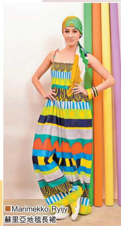
■Marimekko Ryijy 蘇里亞地毯長裙