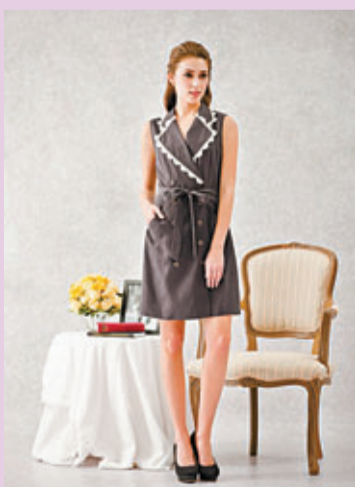
■Jeannette喱士花邊裙，以經典襯衫裙的剪裁配上喱士花邊領口創造出更女性化的造型。

今季Marco Visconti推出散發英國貴族魅力與成熟韻味的全新系列，其「英倫風格」春季系列，意念源自英式莊園貴族，專屬崇尚優雅且充滿自信之時尚都會女性，系列以筆挺剪裁完美呈現女性體態線條美，瑰麗迷人雅致，心思獨運。每件作品盡顯高貴優雅、曼麗簡潔之格調，選用高檔衣料，質感十足，如金屬線提花加上精細織藝，飾以喱士、皮革，讓整套共41件之作品完美展現經典英國莊園感之餘，更別具深度與格調。其可分解環保天然物料，如天絲(Tencel)等，更為此系列級上一抹都市現代感。