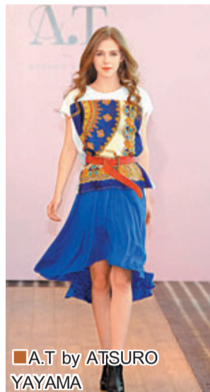
■A.T by ATSURO YAYAMA