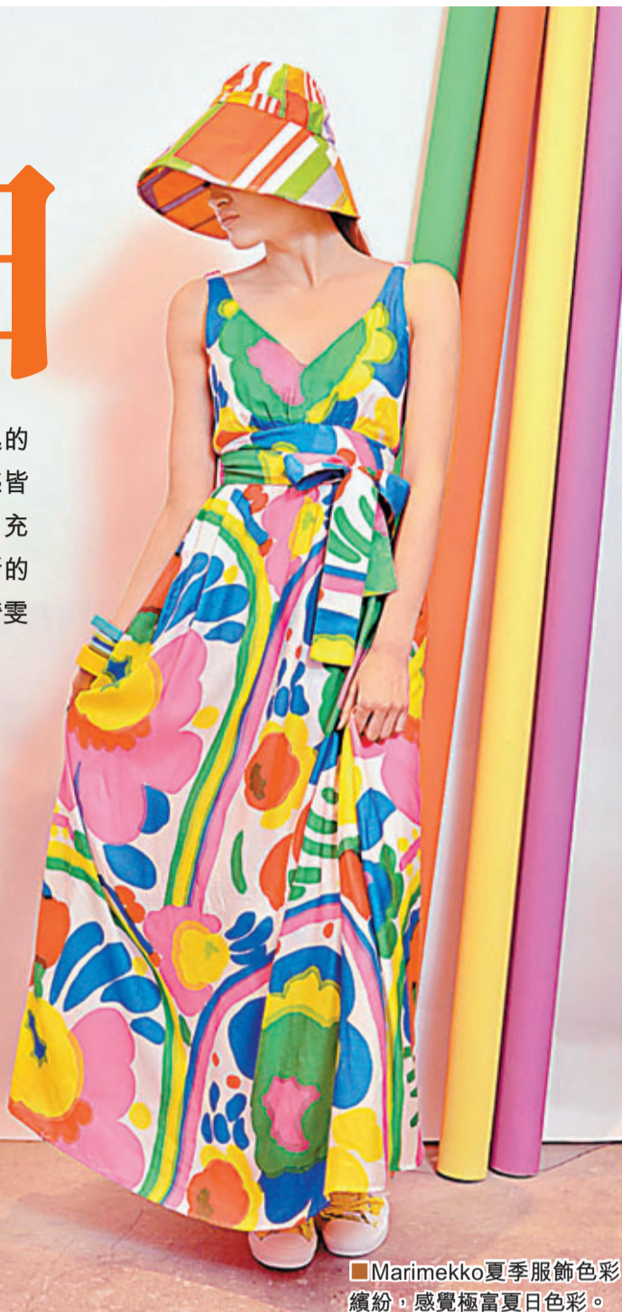
■Marimekko夏季服飾色彩繽紛，感覺極富夏日色彩。