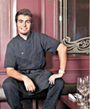
■ Cafe de Paris主廚

第五屆「法國五月美食節」已正式展開，位於中環蘇豪區的Cafe de Pan's，精心設計了傳統風味菜單，在這個五月的美食節中為大家帶來地道滋味。今屆美食節以勃艮第為主題，該地盛產紅酒、芝士及夏洛來牛肉，因此於套餐之中，主廚特別採用這三種重要的食材烹調四道菜精選套餐，讓大家體驗正宗法式風情。套餐的頭盤是香煎煙豬腩配焗蛋甘菊蓉伴法式紅酒汁，半熟的水煮雞配上厚稠的紅酒汁，非常開胃；而主菜的法式紅酒燴牛肉關條麵是講究功夫之作，用上優質的牛肉來炮製，慢煮八小時，令肉質鬆軟，而且充分吸收了紅酒汁的香味，定必一試難忘。