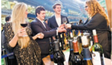
■ 超過50款葡萄酒於啤酒園及場畔美食專櫃供應，你可選購品酒通行證細味品嚐。

位於跑馬地的馬場也將注滿濃濃的法式情懷！在5月15日、22日及29日的星期三晚上，快活谷將上演「法國五月」之夜。跑道上駿馬奔馳爭勝，場畔樂韻悠揚，一邊品味布根地、蘇特恩的著名佳釀、品嚐以精緻見稱的法式美食，一邊欣賞法國當代首屈一指的藝術團體帶來的精彩表演，盡情體會法國的精華所在。