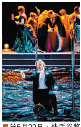
■ 於5月22日，快活谷將有Gadjo Station 爵士樂演出及歌劇表演。