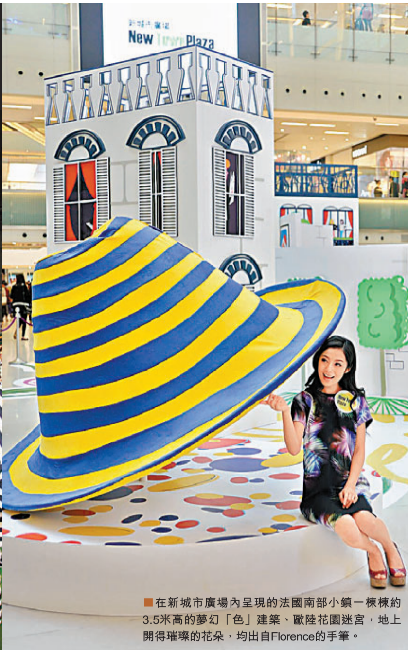
■ 在新城市廣場內呈現的法國南部小鎮一棟棟約3.5米高的夢幻「色」建築、歐陸花園迷宮，地上開得璀璨的花朵，均出自Florence的手筆。