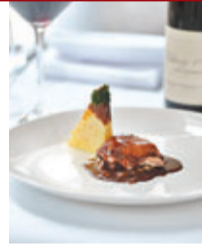
■ ChezPatrick法國五月美食節布根地晚餐 (HK$550/位)

另外，為推崇法式品味生活，從品嚐Kronenbourg 1664中，享受藝術帶給大家的歡愉及快樂。在法國五月，安排了名為「IMMERSE IN FRENCH ART」的法式街頭藝術表演，如法式默劇師、真人銅像及手風琴家，在一個全新流動舞台「立體巨型三米高啤酒杯」(左圖)內演出，讓你從品嚐K1664中，體驗法式藝術情懷，並把法式品味融入生活。