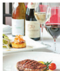
■ Zummer法式4道菜晚餐 (HK$358/位)