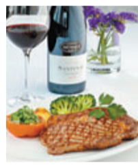
■ W28 Steak House法式4道菜晚餐 (HK$450/位)