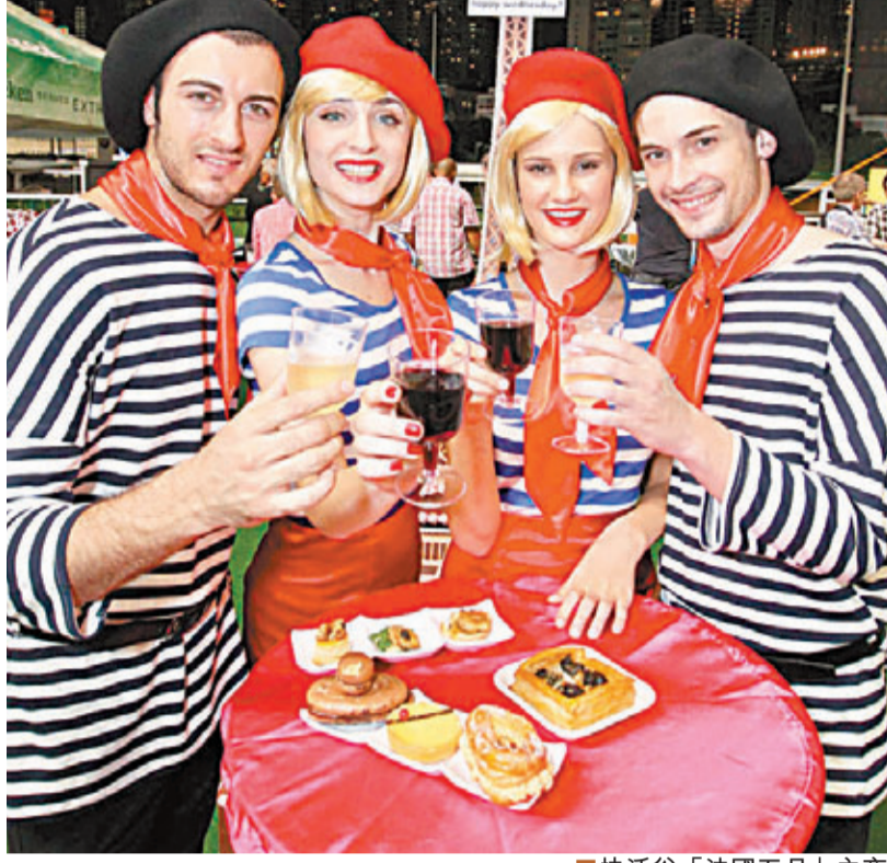
■ 快活谷「法國五月」之夜