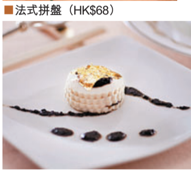
■ 法式拼盤 (HK$68)

要品嚐世界級法國名菜，何需大費周章飛往當地？在快活谷法國之夜，馬會主廚特別邀請米芝蓮星級大廚Alexis Billoux由法國遠道而來，為活動設計出平時難得一見的世界級精緻美食，更首次於場內以優惠價供應，還備有馬會巧手主廚精心炮製的多款菜式及甜品，每款HK$35元起。