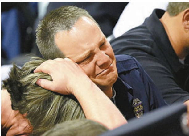
里德早前在悼念會表現出哀傷神情。