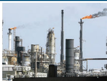
美國煉油廠等設施排放黑煙，令全球二氧化碳含量增加。資料圖片

倫敦帝國學院教授霍金斯表示，地球上出現類似高水平的二氧化碳含量，大概在450萬年前，當時全球平均氣溫還比現在高出攝氏3至4度。科學家估計，地球在18世紀工業革命前，大氣二氧化碳含量僅為270ppm。