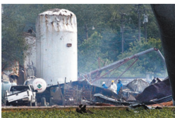
得州化肥廠爆炸後，調查員穿上保護衣物在現場調查。資料圖片