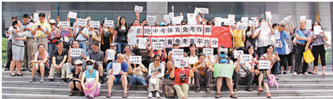
昨日，深圳200餘名學生家長在市民中心外聚集並打出橫額，要求深圳市教育局徹查體育中考存在的腐敗問題。

香港文匯報訊(記者 李薇 深圳報導) 今年是深圳中考體育尖子生可「免試獲滿分」政策執行的最後一年。4月25日，深圳市學生體育聯合會發佈了免試生名單，當中3,116名體育尖子生獲得免試資格，佔參加中考學生人數的5.1%。名單的出爐引起家長不滿，認為當中存在「黑色利益鏈」。昨日，