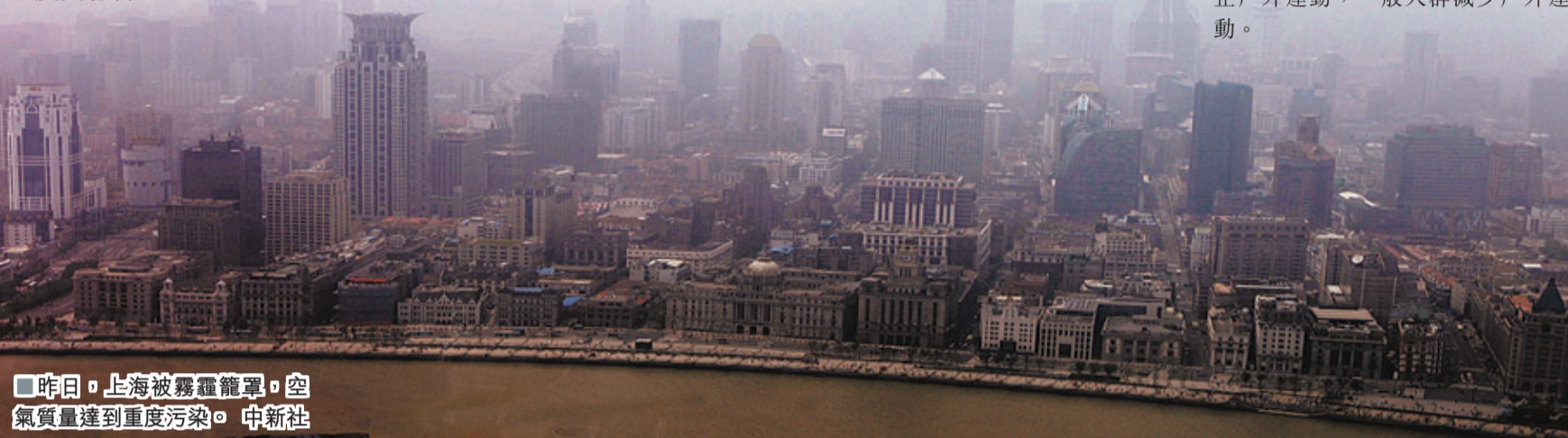
昨日，上海被霧霾籠罩，空氣質量達到重度污染。

氣象專家表示，入夏標準是連續5日均氣溫高於22℃，第一天即為入夏日期。雖然未來4天北京的平均氣溫可以達到22℃，但是下周後期又有一股冷空氣將登場，可能帶來降雨降溫，為其邁入夏季「拖後腿」。