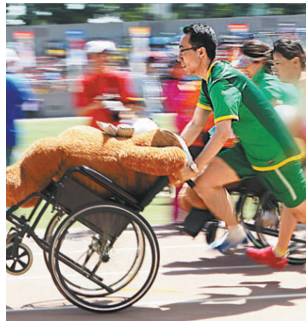
昨日，北京同仁醫院護士冒著33℃的高溫參加推輪椅比賽。

5月6日以來，湖南省大部分地區出現了一次強降雨天氣過程，部分縣市受災。全省累計平均降雨61毫米，暴雨中心為長沙、益陽、永州等地區。這一輪暴雨共造成湖南42個縣(市、區)389個鄉鎮85萬人受災，倒塌房屋2,200多間，緊急轉移1.4萬人，因災死