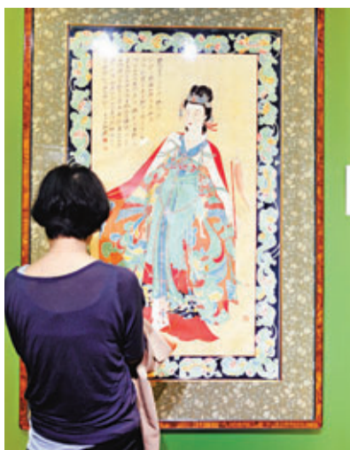
張大千《紅拂女》以7,130萬元成交。

香港文匯報訊 據新華網報導，記者從中國嘉德國際拍賣公司獲悉，正在舉行的嘉德2013春拍會上，張大千1944年創作的《紅拂女》拍出7,130萬元(人民幣，下同)，奪嘉德「大