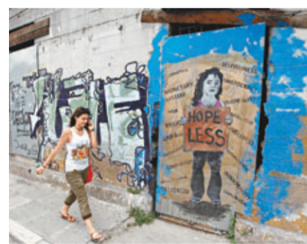
■希臘經濟疲軟，不少商舖和建築丟空。

希臘深受歐債危機衝擊，但無礙民眾大灑金錢整容。統計顯示，希臘前年整容手術次數僅次於「整容大國」韓國，在全球排第2；若按人數計算，去年更是全球最多。有業界人士表示，手術治療費用大幅下降推動整容風氣。