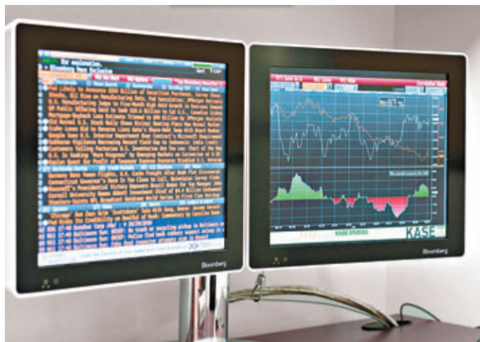
■彭博終端機廣受金融業人士歡迎。