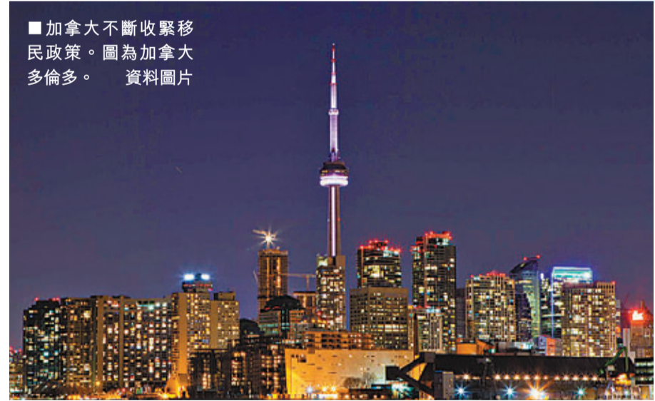
■加拿大不斷收緊移民政策。圖為加拿大多倫多。