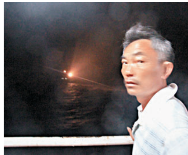
■南沙捕撈船隊的綜合補給船「江海一號」上一名船員在船尾觀察不明船隻。

在跟行襲擾中國船隊一個多小時後,這兩艘不明國家公務船於昨日凌晨4時30分許掉頭離開,整個跟行距離為4海里。目前中國船隊繼續向南行駛。