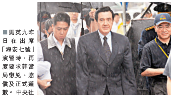
■馬英九昨日在出席「海安七號」演習時,再度要求菲當局懲兇、賠償及正式道歉。

香港文匯報訊 綜合媒體報導,兩岸昨日繼續發聲,譴責菲律賓公務船射擊台灣漁船「廣大興28號」、造成1船員死亡的事件。在台灣,馬英九昨日首度強硬表示,不排除動用任何其他制裁手段。台北市、新北市當天亦分別宣佈,暫停與菲律賓城市間的交流。在大陸,新華社昨日發表國際時評,指菲官方就開槍事件的聲明,是為野蠻行徑開脫責任。《人民日報》海外版昨日亦發表文章強調,決不能允許菲律賓違反國際法在海上撒野。