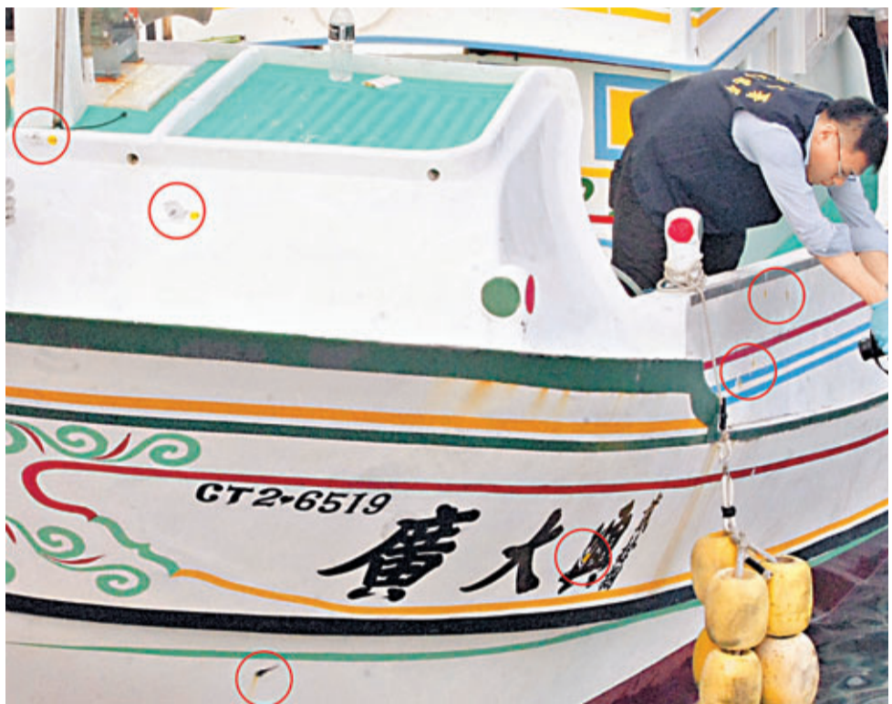
■鑑識人員在「廣大興28號」船身清點出彈孔多達52處。紅圈處即為彈孔位置。

在被問及菲律賓政府是否應對該事件導致台灣漁民死亡道歉時,文特雷爾表示,在美方作出進一步判斷之前,先要看調查的情況。