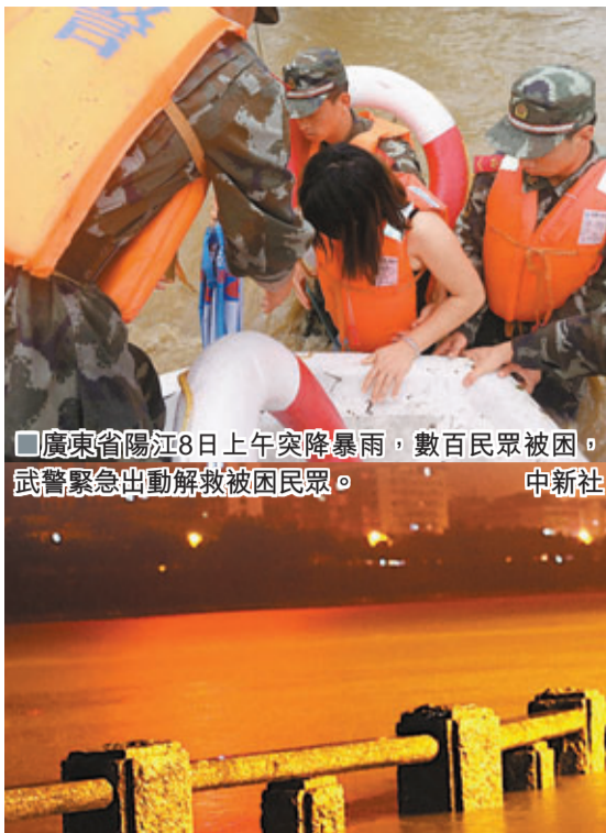
廣東省陽江8日上午突降暴雨，數百民眾被困，武警緊急出動解救被困民眾。

香港文匯報訊(綜合本報記者吳文傳及媒體報道)中國民政部網站10日消息：5月6日以來，中國南方多地出現強降雨天氣，造成安徽、江西、湖北、湖南、廣東、廣西、貴州等省持續遭受洪澇災害。截至5月10日9時統計，各省災情如下：