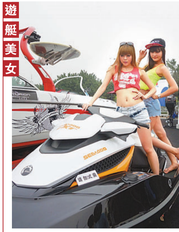
「2013中國(廣州)國際遊艇產業博覽會」10日在廣州舉行。展會上美女模特展示摩托艇。

昨天中午11時30分許，在中堂籃球館附近，圍了不少群眾。透過體育館鐵門的縫隙，可以見到，警方在體育館內增設了一個圍欄，圍欄後面黑壓壓全是被抓來的吸毒客。