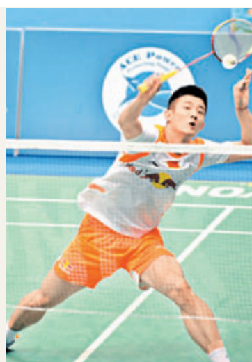
諶龍已成為林丹之後國羽另一實力球員。