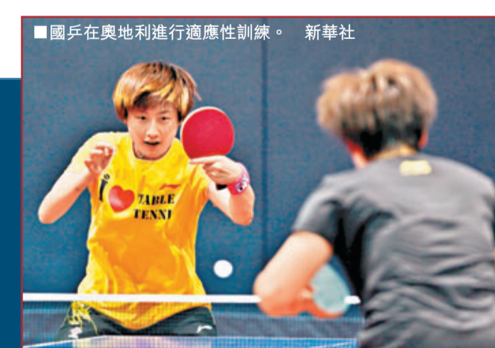
國乒在奧地利進行適應性訓練。