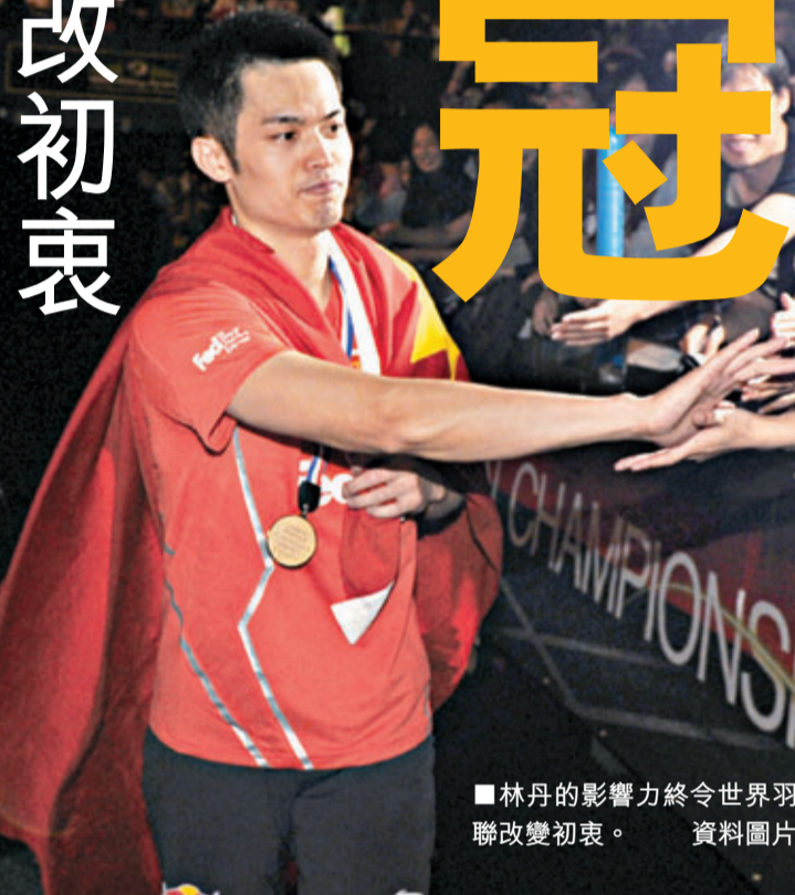
林丹的影響力終令世界羽聯改變初衷。