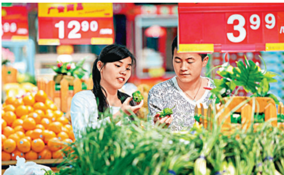
內地4月通脹升2.4%,其中以菜價升幅較顯著。

面對外界降息的呼聲,中國央行昨日發布一季貨幣政策報告表示,「主要經濟體寬鬆貨幣政策的負面溢出效應加大,助推了國內信用的順周期擴張。當前物價對需求擴張仍比較敏感,在物價總水平回落的同時,要前瞻性引導、穩定好通脹預期。」央行表示,繼續實施穩健的貨幣政策,統籌考慮穩增長、控通脹、防風險。綜合運用數量、價格等多種貨幣政策工具組合,引導貨幣信貸及社會融資規模平穩適度增長,維持貨幣環境的穩定,保持價格總水平基本穩定,有效防範系統性金融風險,促進經濟持續健康發展。