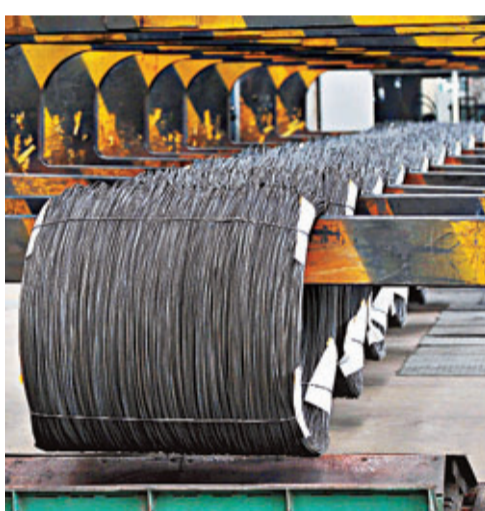
內地PPI跌至半年來新低,反映經濟復甦乏力。