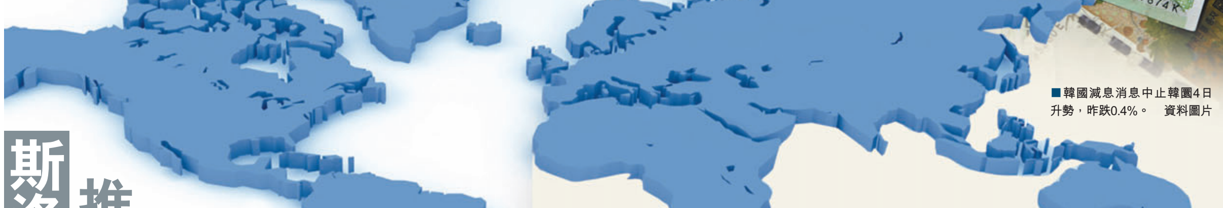
■韓國減息消息中止韓國4日升勢，昨跌0.4%。資料圖片