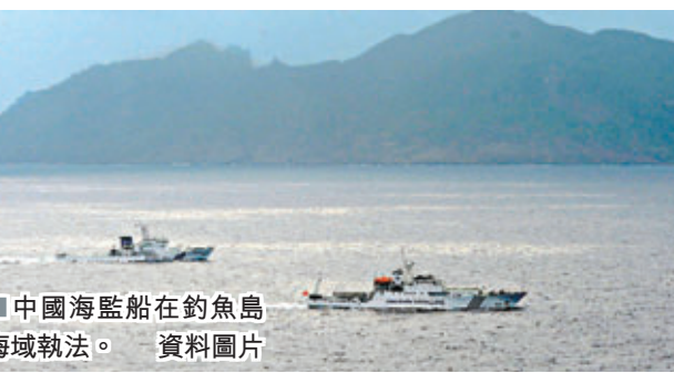
中國海監船在釣魚島海域執法。資料圖片

《產經新聞》稱，中國海監船「海監66」從5日開始，在釣魚島毗鄰水域巡航，8日上午9時在黃尾嶼以北，駛出該水域。