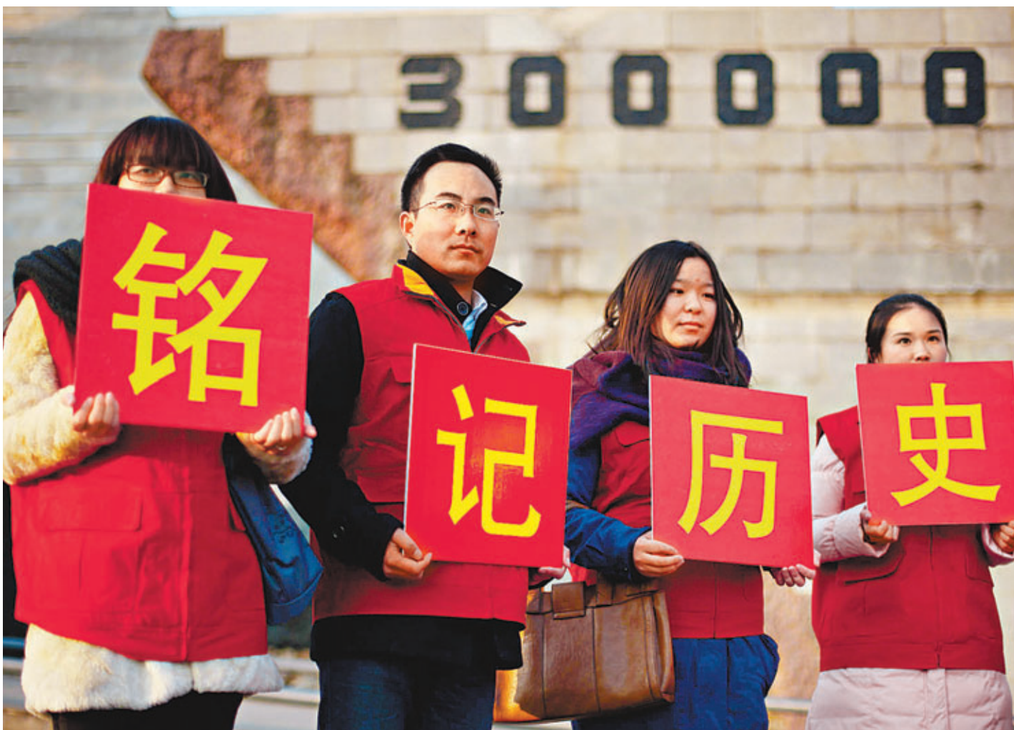
日本安倍政府最近頻頻作出否定歷史的挑釁舉動。圖為去年12月12日，手持「銘記歷史」的中國年輕人在侵華日軍南京大屠殺遇難同胞紀念館內舉行悼念活動。

朴槿惠還稱，對歷史麻木的人不可能看見未來。韓國外交部發言人9日則在記者會上再次強調：「日本領導人應當正視歷史，抱有正確的歷史認識。這對韓日關係及地區發展也很重要。」