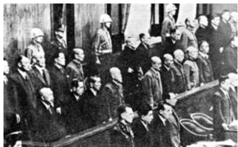
1946年5月3日，遠東國際軍事法庭在日本東京對第二次世界大戰中的日本首要戰犯進行審判。

本對待歷史問題的態度提出譴責。她向美國總統奧巴馬提出，日本應該糾正其歷史觀念，並尋求美國的支持。