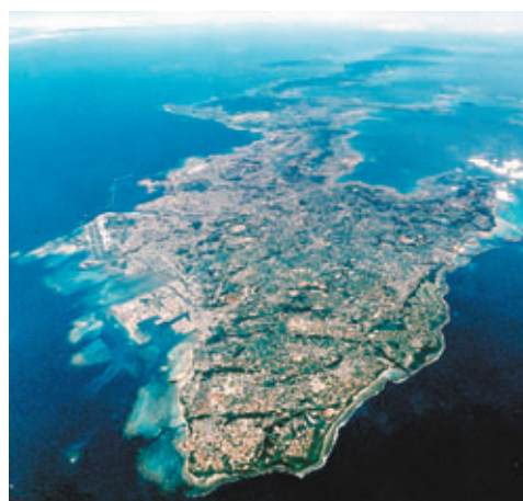
琉球群島鳥瞰圖。資料圖片

香港文匯報訊（記者 葛沖 北京報道）《人民日報》日前刊文重申釣魚島主權並對沖繩主權歸屬提出質疑，引起日方抗議，但中國外交部昨日表示中方不接受日方所謂「抗議」。