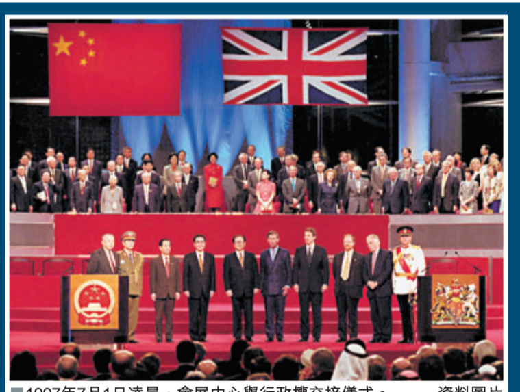
1997年7月1日凌晨, 會展中心舉行行政權交接儀式。

他坦言, 自己個人對個人遊還是有保留的, 認為放得太開了, 特別是「一簽多行」, 但「香港人也不能太功利主義, 現在又覺得去的人太多了, 把物價抬高了, 又要限制了, 香港內部問題可以通過協商解決矛盾, 不要公開地來做」。內地老百姓看了也有個感情問題, 覺得香港人太功利主義, 「招之則來, 揮之則去, 不要你們就走」, 又說內地人是「蝗蟲」甚麼的語言, 是傷了感情。