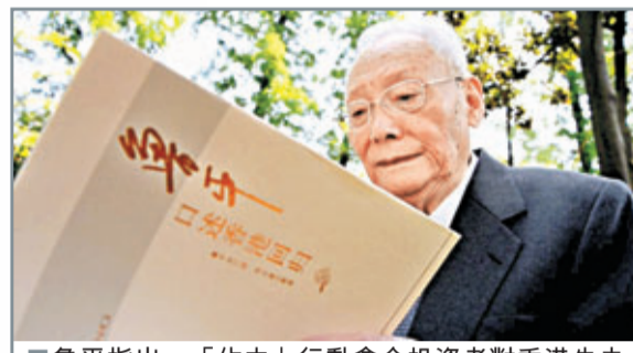
魯平指出, 「佔中」行動會令投資者對香港失去信心。

他呼籲, 香港要有危機感, 「大家來協調, 甚麼事情都要有個妥協, 有個餘地, 不能我主張甚麼, 我就不能動了。你不妥協, 甚麼事情都解決不了」。