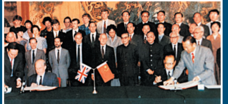
1984年9月26日, 中英草簽《中英聯合聲明》。