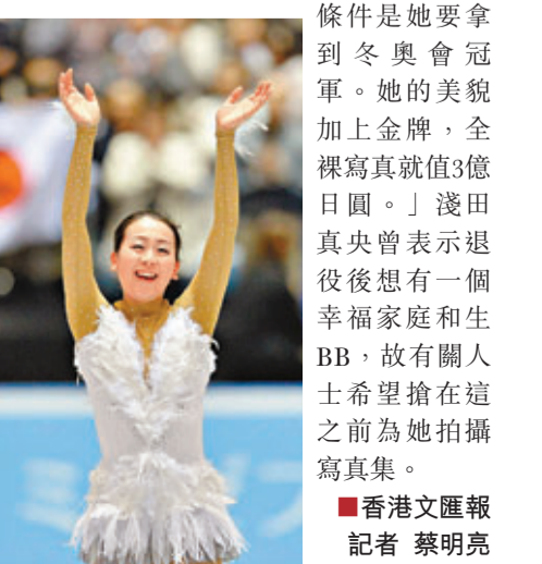
淺田真央。香港文匯報記者蔡明亮

淺田真央上月中在東京舉行的世界團體錦標賽結束後宣布，將於明年的索契冬奧會後退役。據《週刊實話》雜誌引述一位演藝事務所工作人員透露：「淺田真央退役後，應會作為花滑藝人繼續活動，但她不僅是單純的藝人，她身材非常好。據說不少藝能界人士已經接觸過淺田真央方面，正計劃在她退役後拍攝全裸寫真。」