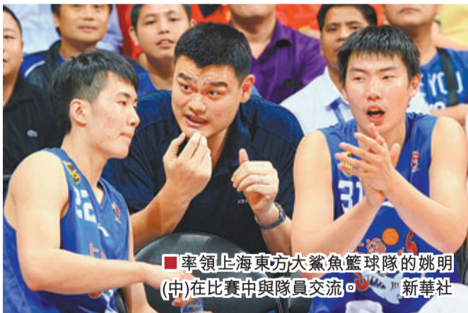
率領上海東方大鯊魚籃球隊的姚明(中)在比賽中與隊員交流。