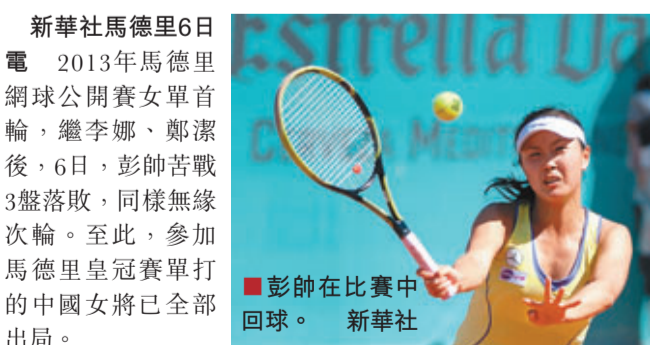
彭帥在比賽中回球。