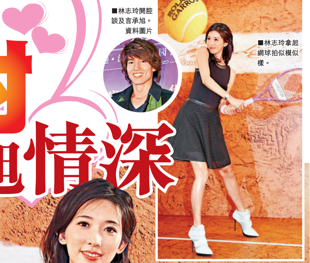
林志玲開腔談及言承旭。資料圖片