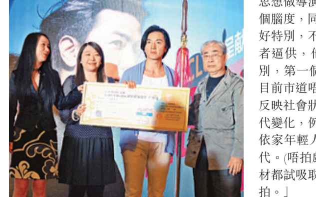
鄭伊健(右二)與多位藝人合影。

鄭伊健昨日舉行記者會，席上播出好友林曉峰和錢嘉樂打氣片段，還有大批廣州粉絲到場支持，令伊健非常感動。訪問時，伊健表示演唱會會唱一些國語歌，但也希望藉着演唱會，令更多人喜歡廣東歌。他坦言以前沒有自信，所以感到很大壓力，他說：「無論唱歌和演戲都沒有信心，但現在過咁多年，累積了經驗，做事多了自信，這就是成長。」被指是完美男人，伊健謙稱不敢當，在他心目中成熟男人是穩重而且有承擔，他說：「成熟男人想法較穩重，不容易搖擺，年青人思想簡單直接，現在我處事會從經驗出發。」伊健透露除了唱歌和拍戲，還心思想做導演，他說：「其實我有一啲題材喺個腦度，同過一啲圈中人傾過，但地都覺得好特別，不過唔得住。」結果伊健被全場記者逼供，他才透露：「其實我諗咗兩個種別，第一個係『抽離』，比較天馬行空，但目前市道唔係咁啱，第日先講。另一個係反映社會狀態，唔係講我嘅故事，係講大時代變化，例如我哋係見證資訊發達嘅過程，依家年輕人無經歷過我哋連call機都無嘅年代。(唔拍戲?)拍，好劇本就拍，以前乜題材都試吸經驗，依家揀好玩和開心嘅電影拍。」