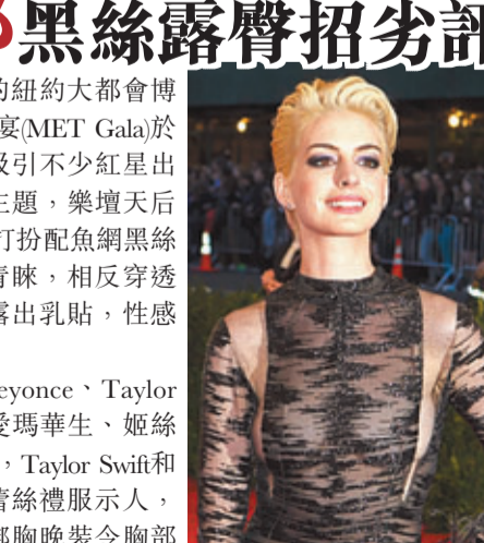
■安妮夏菲維透視裝非常惹眼。