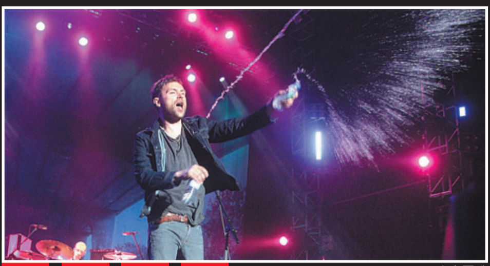
■Damon向台下歌迷灑水。