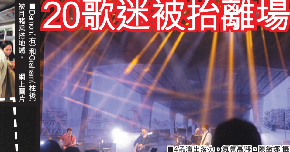
■4子演出落力，氣氛高漲。

因 今次是Blur自1991年成軍後，首度來港開騷，演唱會開始前半小時，所有紀念品已被搶購一空。鑑於他們取消了台灣及日本的演出，吸引不少海外歌迷來港捧場，部分站在第一排的歌迷拉起橫額，表明自己是從台灣來表演，亦有歌迷舉紙牌預祝鼓手Dave Rowntree今日生日快樂！