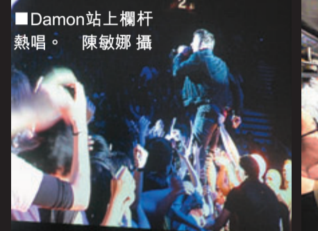
■Damon站上欄杆熱唱。