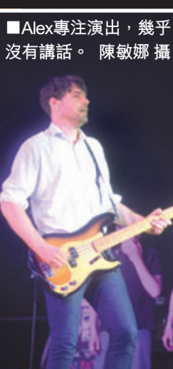
■Alex專注演出，幾乎沒有講話。

香港文匯報訊(記者 陳敏娜)英國4人搖滾勁旅Blur前晚假亞洲國際博覽館舉行首個香港演唱會，全場爆滿，陳奕迅夫婦、五月天成員石頭、周柏豪、梁漢文等紅星都來朝聖。當晚Blur熱唱19首大熱作，歌迷表現太熱烈，有約20名站在前排的歌迷因身體不適需被抬離場，其間主音Damon Albarn自爆會留港一星期錄製新碟，全場即時歡呼起哄，可謂送給港迷最好的禮物。