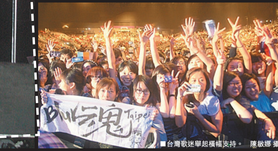
■台灣歌迷舉起橫幅支持。

安哥時，Damon自彈自唱新歌《Under The Westway》，又高呼香港，最後他們以快歌《Song 2》結束個唱，並多次道謝感激歌迷的熱情支持。完騷後，他們透露對歌迷留下深刻的印象，想不到歌迷幾乎全部歌都懂得唱，十分開心。昨日下午，Blur4子被目擊在中環乘搭地鐵，他們沒有變裝，似乎不怕被歌迷認出。