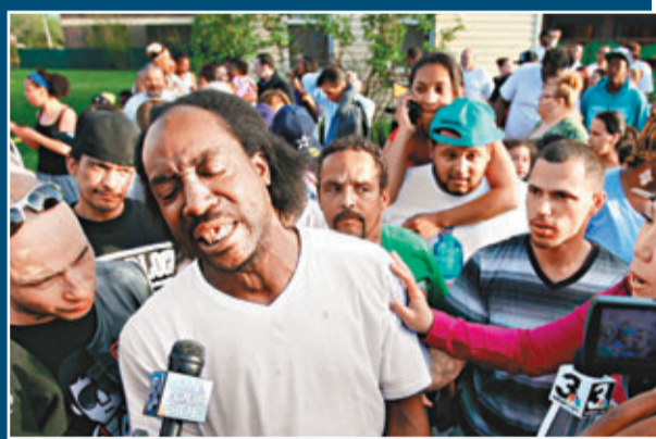
拉姆齊事後接受傳媒訪問。