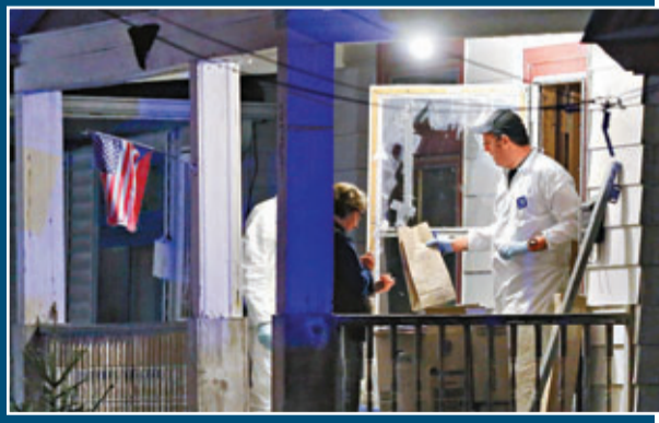
FBI在肇事住所搜證，相中清楚見到，大門玻璃被碎。