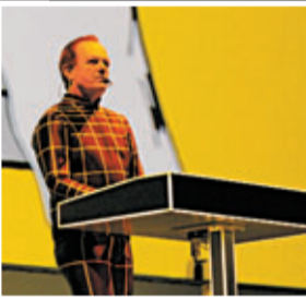
■主腦Hütter以效果樂器造出多種電子聲。

不過，有部分歌迷不守秩序，不但用手機錄影，亦有人在場內吸煙。當他們唱畢《Boing Boom Tschak》和《Techno Pop》組曲時，有歌迷叫安哥，Hütter搞笑地扮看手錶，最後他們以1986年的作品《Musique Non-Stop》結束個唱。4位成員逐個離台，最後離開的Hütter更分別以英文、中文及德文跟歌迷說再見，比上次港騷多說了中文，為個唱帶來最後一個驚喜。