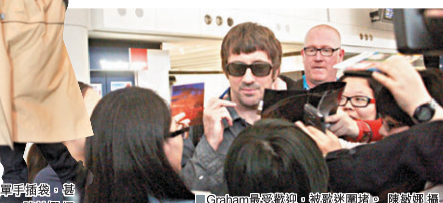
■Graham最受歡迎，被歌迷圍堵。