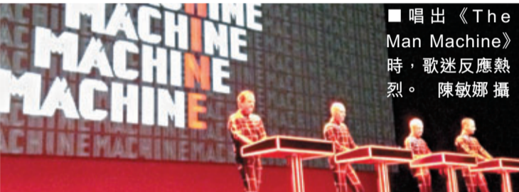
■唱出《The Man Machine》時，歌迷反應熱烈。