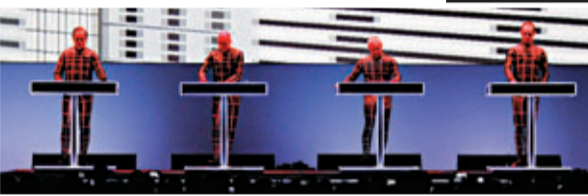
■Kraftwerk全晚穿着螢光衣演出。