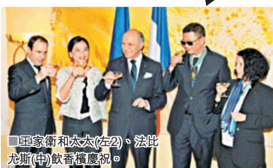
■王家衛和太太(左2)、法比尤斯(中)歡慶授勳。

王家衛的電影原來深受法國人賞識，早在2006年他已獲法國政府頒授由已故法國皇帝拿破崙成立的法國榮譽軍團最高等級的「騎士級」勳章，表揚他在電影藝術上的成就。今次在港獲頒「法國藝術與文學司令勳章」，王導演更覺有意義，因在自己的地方得獎。法國外交部部長法比尤斯讚王家衛將香港文化推廣到法國，指他在法國已有很大的影響力和地位，而法國駐港總領事柏雅諾夫婦以及法國駐北京大使白林亦有出席。