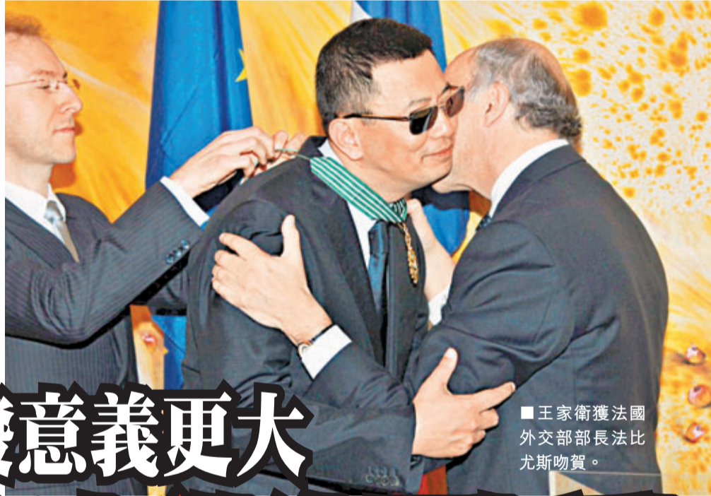
■王家衛獲法國外交部部長法比尤斯吻頰。

香港文匯報訊(記者 吳文釗)王家衛導演昨天出席《法國五月藝術節》，獲法國外交部部長法比尤斯(Laurent Fabius)頒發法國文化最高榮譽的「法國藝術與文學司令勳章」，王家衛太太和梁朝偉、張震及杜可風等好友到賀觀禮。王導演稱獲頒勳章是對他及其團隊的一個榮譽，同時也證明外國也很認同及支持。