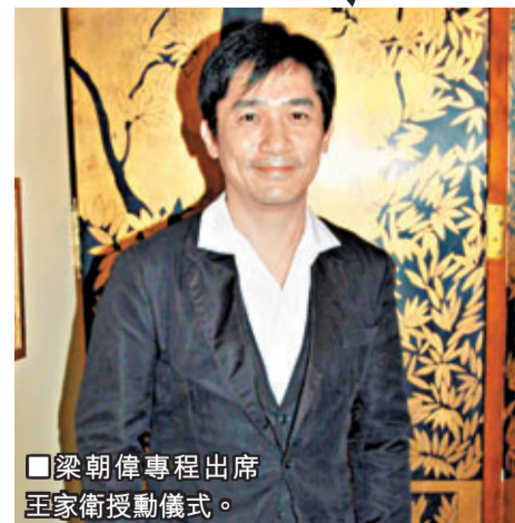
■梁朝偉專程出席王家衛授勳儀式。