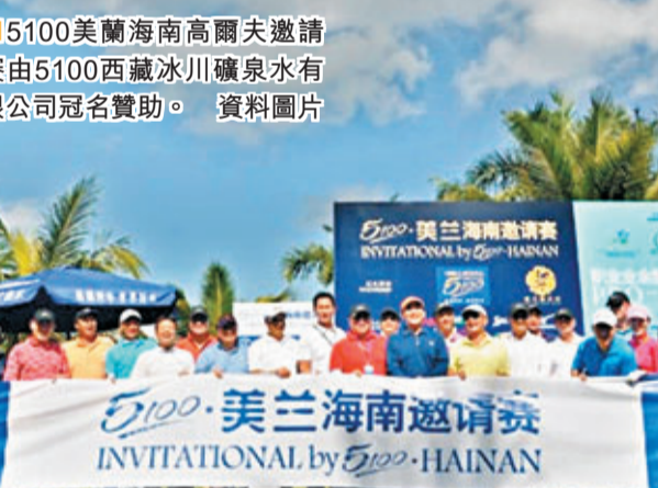
5100美蘭海南高爾夫邀請賽由5100西藏冰川礦泉水有限公司冠名贊助。資料圖片