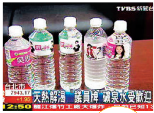
瓶裝水也成了台灣議員的廣告平台。資料圖片