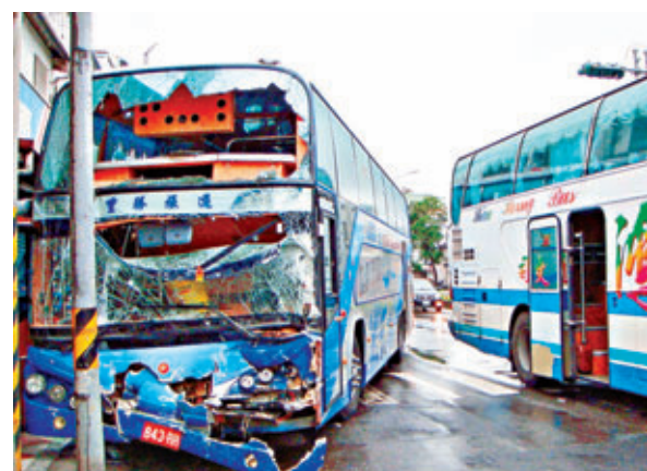
圖為兩輛遊覽車相撞現場。中央社

香港文匯報訊 據中央社報道，兩輛分別搭載重慶和陝西陸客的遊覽車，昨午4時許疑似因天雨路滑在台灣花蓮縣新城鄉嘉里路發生擦撞，造成2車18名陸客輕傷送醫。據警方調查，1輛遊覽車停等紅燈時，遭後方的遊覽車追撞。目前傷者已送往台軍花蓮總醫院救治。