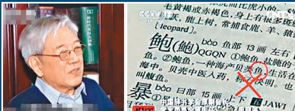
■著名辭書專家周明鑒直指，這本字典對在求知初級階段的中小學生危害巨大。視頻截圖