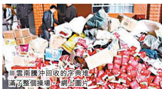
■雲南騰沖回收的字典堆滿了整個操場。網上圖片

香港文匯報訊(記者 俞鯤)內地由財政專項資金定向採購、並免費向貧困地區贈送的教材頻遭盜版問題。2006年，江西贛州、萍鄉等地市由政府財政採購、贈送學生的國家免費英語教材錄音帶，不斷被投訴係盜版，無法正常使用。經調查，這些問題錄音帶是江西紅星電子音像出版社出版、江西省新華書店自己找人根據教材進行錄製，然後對正版音像教材包。直至2009年1