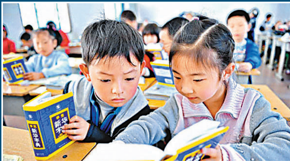
■湖北保康縣實驗小學的兩位小學生，剛領到免費《新華字典》，就急不可耐地翻閱起來。網上圖片