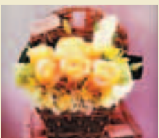
■「Deep in my heart」