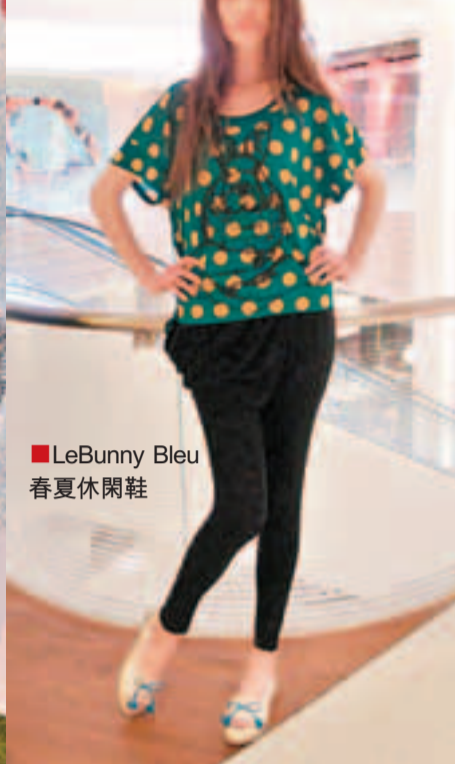
■ LeBunny Bleu 春夏休閒鞋