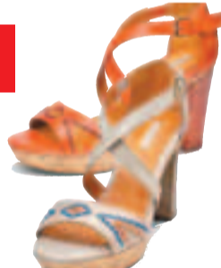
■ GEOX Heritage ($1,899)

著名意大利休閒鞋履品牌GEOX，結合了時尚與技術，推出一系列專為男女及兒童而設的鞋履，備有獨一無二的專利技術，使鞋底發揮透氣及防水作用，讓雙腳能保持乾爽及舒適狀態。其釘飾和手工縫製的珍珠色芭蕾舞鞋、厚底loafers、ankle boots款運動鞋都運用了帶孔會呼吸技術，完美體驗舒適與時尚並重的GEOX風格。加上，夏日臨近，有什麼比散發出溫暖香氣的鞋子更能刺激人的感官、讓人激情四射呢？天然材質加上時尚的繫帶涼拖，軟木底、草織底、厚跟底，選擇豐富多樣。