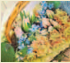
■「Be be sept」母親對兒女的心思是需要回報的