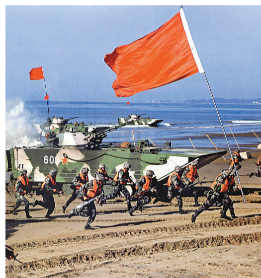
《解放軍報》署名文章認為，要以打仗的思維抓訓練、抓工作、抓準備。

香港文匯報訊 《解放軍報》昨日發表文章說：「軍人生來為打贏。戰場打不贏，一切等於零；準備打才可能不必打，愈不能打愈可能挨打。」