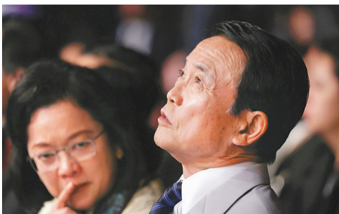
日本副首相兼財務大臣麻生太郎對中韓財長缺席會議感尷尬。

麻生太郎在3日的記者會見中，被問到中日韓財長沒有出席這一次會議，是否是因為他參拜靖國