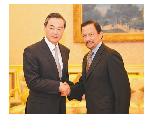
汶萊蘇丹哈桑納爾（右）會見到訪的中國外交部長王毅。

王毅表示，習近平主席與蘇丹陛下一致同意將中汶關係提升為戰略合作關係，顯示了兩國深厚的友誼和互信，雙邊關係將迎來穩定發展的新時期。中汶要根據各自發展需要，推動全方位合作。中方將繼續支持企業參與汶萊經濟多元化發展戰略，與汶方重點開展能源、基礎設施、農漁業、教育、文化、醫療衛生、旅遊等領域合作。