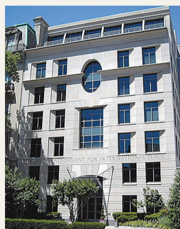
卡內基國際和平基金會辦公大樓。

該基金會也把「培養軍備控制、地區安全、國際法等國際事務研究與活動的人才」作為其重要宗旨之一。