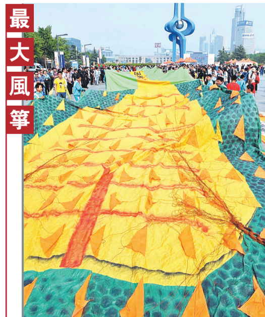
山東濟南昨日舉行的「放飛中國夢」公益活動，一隻獲得健力士世界紀錄的風箏亮相。據了解，這隻風箏長達293.8米，面積達882.41平方米，是目前世界上最大的單體風箏。

路透社報道，一名接近歐盟決策的消息人士說，古赫特已經對中國實施制裁做好準備，歐盟在對中國的反傾銷案中擁有充分證據。