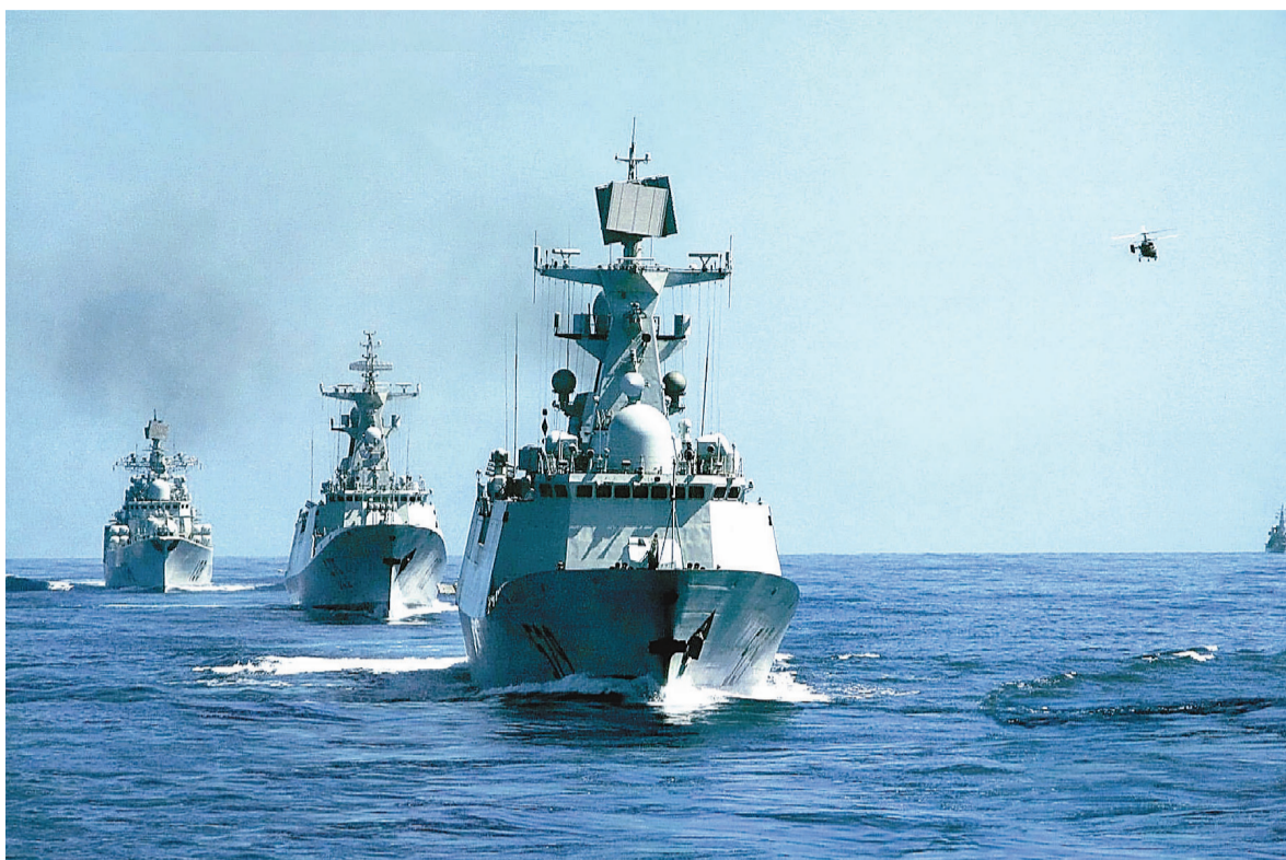
美國智庫報告認為，在未來15至20年間，中美在製造航母和隱形戰鬥機等軍事能力方面的差距將會縮小。圖為中國軍艦編隊。

的可能性問題，報告指出，在第二次世界大戰戰敗後，日本在軍事上一直依附在美國的保護傘下，隨着美國亞太再平衡戰略的進一步實施，日本可能會以更加緊貼美國的方式來應對中國日漸增長的實力。「日本的財困和政治癱瘓令這種可能性不大，最大的風險就是發生局部衝突，比如目前中日就爭島嶼產生的衝突出現意外升級。」