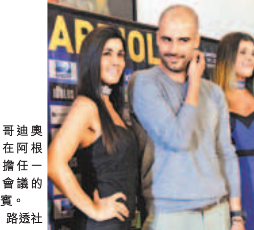
哥迪奧拿在阿根廷擔任一個會議的嘉賓。