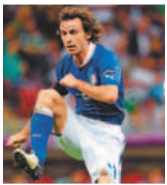
派路是意足中場核心。

意大利國足中場發動機派路在他剛出版的自傳中透露，他將於2014年巴西世界盃後從國家隊退役，專心致志地踢好祖雲達斯的比賽。盛傳法甲巴黎聖日耳門(PSG)前鋒伊巴謙莫域有意回巢祖雲達斯，《都靈體育報》稱，這位瑞典前鋒也已承認：「我想離開巴黎，球季結束後就離開。」說到PSG，上仗被對手的「演技」累得直接領紅牌的碧咸上訴得直，只停賽1場，而賽後與對方球員發生肢體衝突的門將施列古則停賽兩場。另AC米蘭中場蒙杜利因傷或會缺席餘下4場賽事。