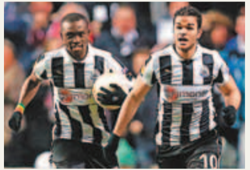
柏比斯施斯(左)與賓文化兩位進攻主力能否拯救紐卡素？

「昆流」上仗和雷丁0:0，雙雙提前宣告來季要降落英冠。今晚即使主場出擊，但戰意難比阿仙奴，加上後衛基奧特化森巴與中場胡禮菲