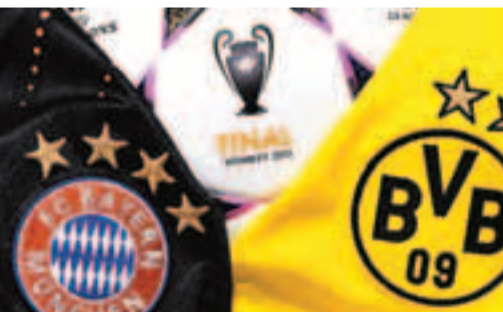
拜仁(左)與多蒙特月底將在歐聯決賽交鋒。

今晚德甲聯賽倒數第3輪，拜仁慕尼黑作客挑戰上兩季冠軍多蒙特(有線61、64台及201、203高清台週日凌晨12:30a.m.直播)。拜仁已提前6輪奪冠，領先第3名利華古遜8分的多蒙特也基本鎖定亞軍，所以本輪勝負已不重要。不過周中兩隊均淘汰對手會師歐聯決賽，這場例行公事遂成了歐聯決賽的預演。