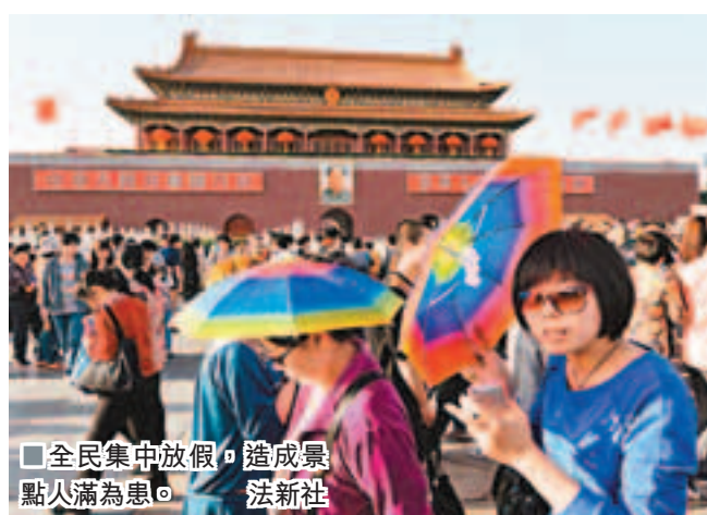
■全民集中放假，造成景點人滿為患。

「黃金周」是1997年亞洲金融危機的產物。1999年，為了拯救低迷的經濟、拉動內需和打開國內的旅遊市場，中國從日本舶來了「黃金周」這個概念。但施行十多年來，各種問題也逐漸暴露。全國人大代表、清華大學教授蔡繼明一直致力於呼籲取消黃金周，提倡從「集中休假」為「分散休假」，從「全民統一強制休假」過渡到「個人自由休假」。他表示，雖然「黃金周」制度的實行一度帶來消費熱潮，但隨着時間的推移，其影響力正呈現出逐年衰退的趨勢。同時，其自身的缺陷及由此而引發的各種社會問題日益顯現。