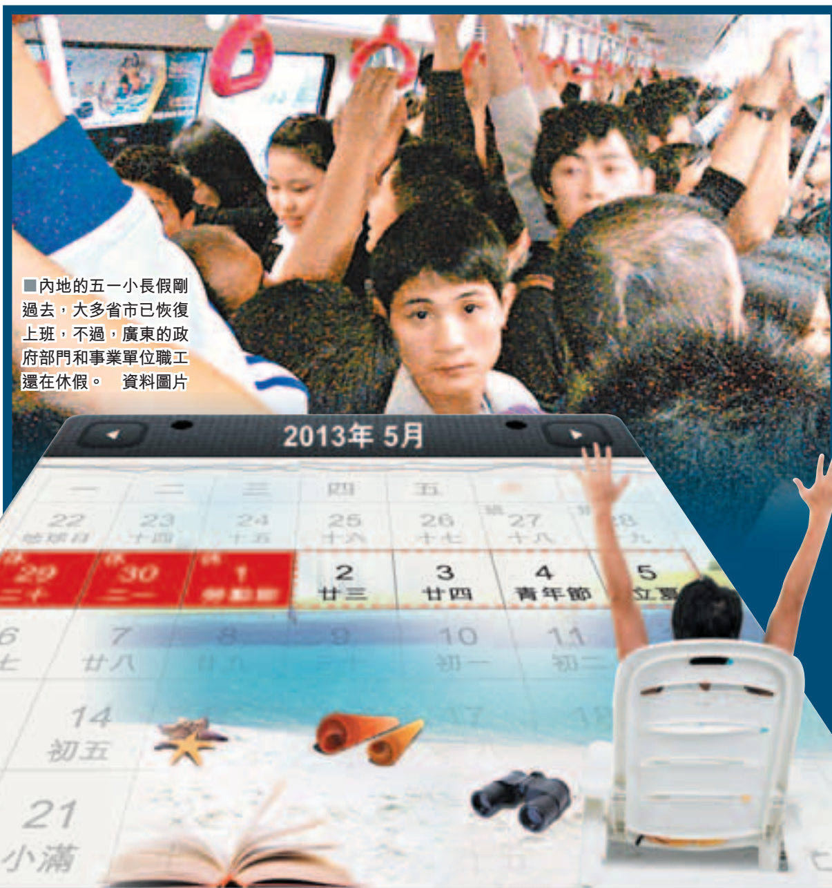
■內地的五一小長假剛過去，大多省市已恢復上班，不過，廣東的政府部門和事業單位職工還在休假。資料圖片

有證券人士指出，中國股市已經是亞洲地區每天交易時間最短的國家，每天只有四個小時，其他國家如西方發達國家，每天交易都六到八個小時。日本甚至已經開通了夜盤交易。中國致力於打造世界金融中心，希望引進QFII，但基本的遊戲規則卻難以和世界接軌，不僅每天的交易時間最短，連最基本的四個小時交易，都沒保證，總是比別的单位多休息。