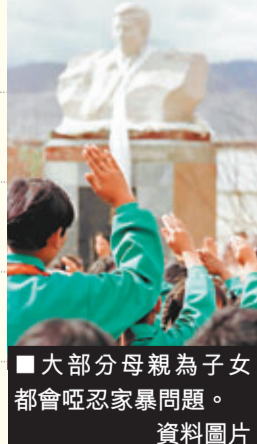
大部分母親為子女都會啞忍家暴問題。 資料圖片