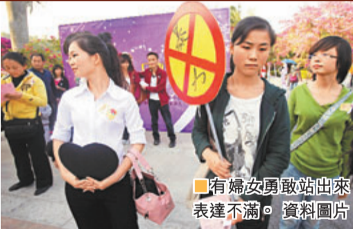
有婦女勇敢站出來表達不滿。