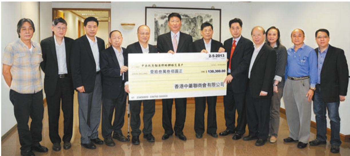
香港中藥聯商會捐款逾13萬元。