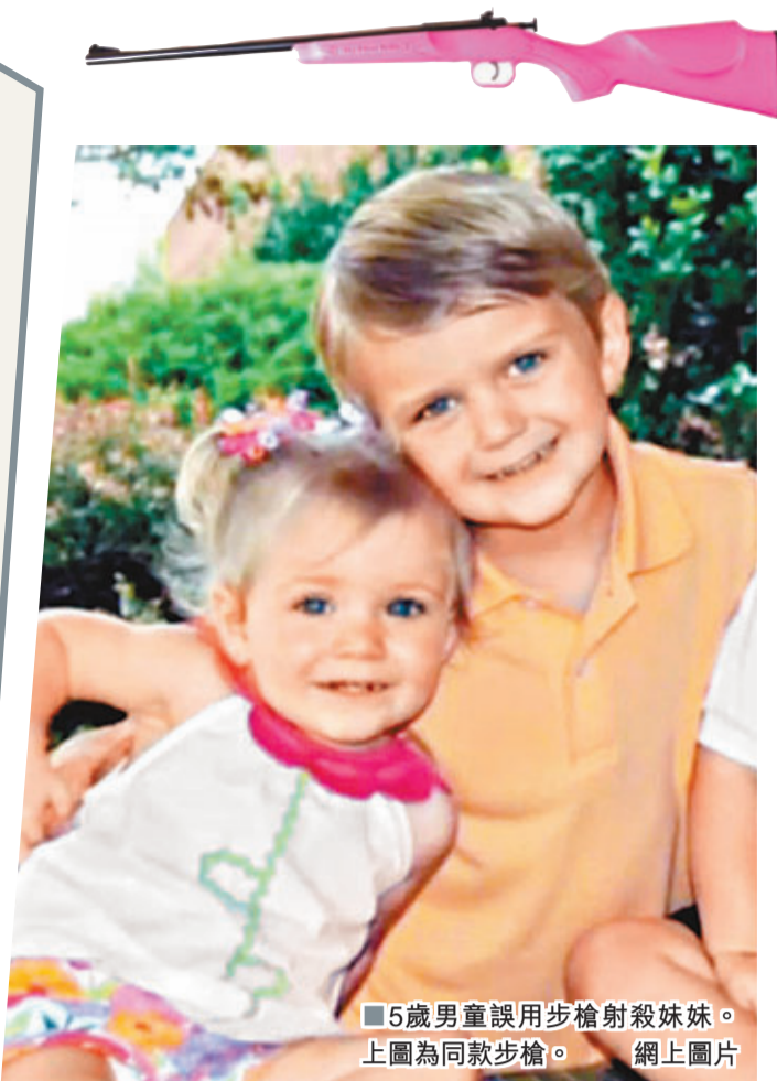
5歲男童誤用步槍射殺妹妹。上圖為同款步槍。網上圖片