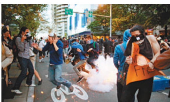
西雅圖警方施放閃光彈，部分示威者被嚇至彈起。

市長麥金稱，鑑於波士頓恐襲陰霾未散，事前已呼籲警方加強戒備，但無預料會暴力收場，慨嘆事件令西雅圖蒙羞。警方強調當時非常克制，為保障社會安全才採取行動。西雅圖五一遊行連續第2年爆發衝突，去年大批無政府主義者四處破壞，包括毀壞一幢聯邦政府大樓。