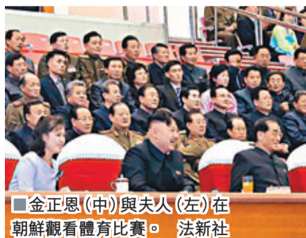
金正恩(中)與夫人(左)在朝鮮觀看體育比賽。

美國一家研究機構稱,朝鮮3年前開始興建的輕水反應堆即將竣工,有望在明年上半年全面投入運行。據信這座反應堆主要用於發電,但也可用來生產核武原料。