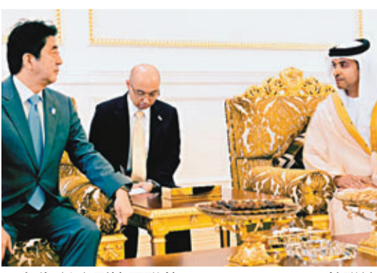
安倍(左)到訪阿聯酋。

日本首相安倍晉三擁護核能態度鮮明,據報他將無視美國政府反對,堅持重開青森縣六所村核燃料循環設施,華府擔憂此舉或加速東北亞及中東地區的核科技以至核武競賽。六所村設施每年可生產9噸武器級鈾元素,足以製造多達2,000枚核彈,日本官員則強調設施只屬民用。