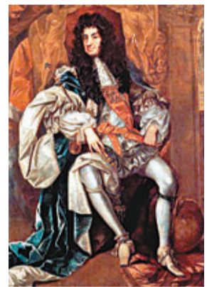
英國女王安妮(見圖)愛喝混有頭骨粉末的酒,到民眾前往斷頭台排隊買人血飲用,歐洲社會上下均對吃人文化,可見影響之深。 ■《每日郵報》