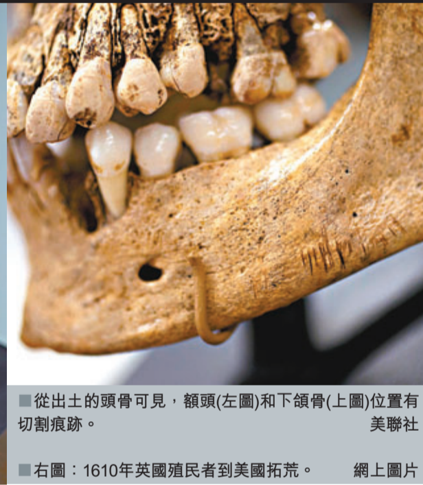
從出土的頭骨可見,額頭(左圖)和下頷骨(上圖)位置有切割痕跡。右圖:1610年英國殖民者到美國拓荒。