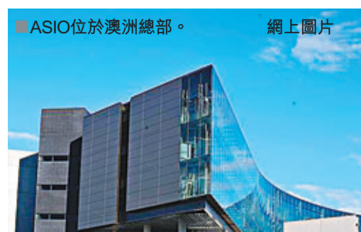
ASIO位於澳洲總部。網上圖片 撤職一事上訴聯邦法院。法庭資料顯示,有4名NIS官員得到外交掩護在堪培拉活動,而金姓專家曾獲邀到一名韓國駐悉尼大使館員工家中吃晚飯。 ■法新社/路透社/《悉尼先驅晨報》

ASIO指事件嚴重損害澳洲利益。該貿易專家認為與韓國外交官接觸只是社交行為,並把被