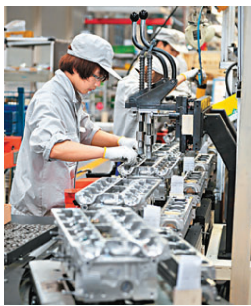
■產能過剩使企業經濟效益下滑，或無力償還金融機構貸款。

此外，報告認為，產能過剩仍是困擾未來一段時期經濟增長的重要問題。製造業產能過剩問題嚴重，另一方面這些行業的投資仍在增長，且大部分為現有水平的重複投資，「新的中低端產能繼續積累，導致過剩程度進一步加劇」。