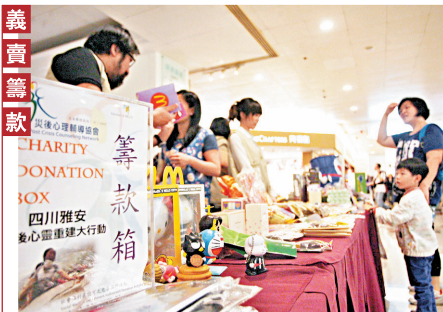
「災後心理學會」昨日舉行雅安加油慈善義賣,希望將籌得的款項,為劫後餘生的災民提供心理輔導,撫平創傷。