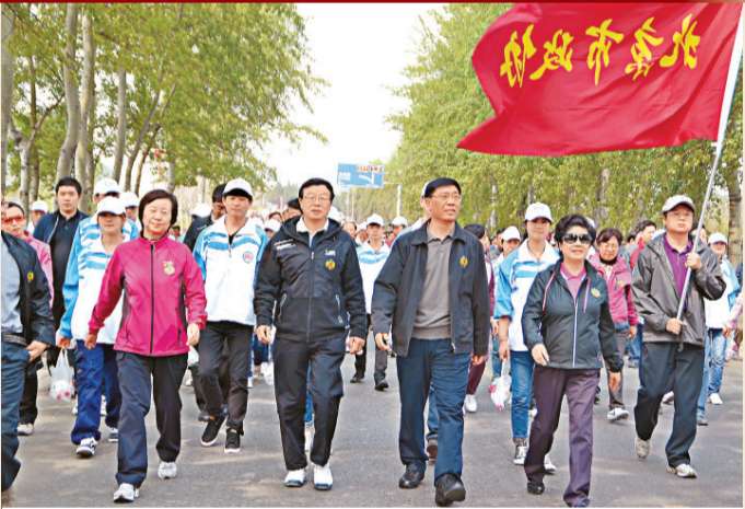
4月27日，北京市政協舉行春天長走活動，紀念「五一口號」發布65周年。

香港文匯報·人民政協專刊訊（記者馬曉芳）「五一口號」的發布是我國統一戰線和多黨合作發展史上的重要里程碑。進入4月下旬以來，各地政協陸續舉辦各種活動，隆重紀念中共中央「五一口號」發布65周年。