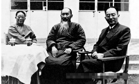
1949年初，解放戰爭已取得決定性勝利。張瀾、羅隆基卻被國民黨軟禁在上海虹橋療養院。圖為張瀾（中）和羅隆基（右）等在該院留影。

中國的協商民主，產生於革命、建設特定的政治生態環境，形成於各民主黨派、無黨派民主人士響應中共中央發布的「五一口號」。1948年4月30日發布的「五一口號」是我國多黨合作發展史上一個具有里程碑意義的事件，標誌着民主協商政治建設和政黨制度建設揭開了新的一頁。