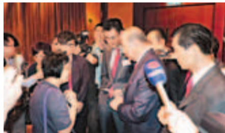
李國寶上前與小股東交談。

前政務司司長許仕仁遭東亞銀行(0023)入稟高院追債,有傳東亞向其批出無抵押貸款,估計涉額高達6,000萬元。東亞主席李國寶昨被小股東要求交代詳情及具體金額,惟他僅回應稱,按法例不便回答數額,但希望許仕仁早日還錢,現已作出法律行動。小股東對李的回應表示不滿。