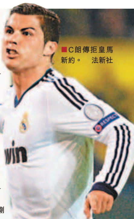
■C朗傳拒皇馬新約。