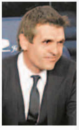
■香港文匯報記者 梁啟剛

巴塞將在主場跟拜仁展開歐聯4強次回合對決，首回合巴塞客場0：4慘敗。縱然劣勢很大，但對於此番完成逆轉，巴塞主帥維蘭路華(見圖)卻顯得很有信心，《世界體育報》從巴塞內部獲悉，維蘭路華要求巴塞在上半場便取得至少2：0的比分優勢。 從2008/09賽季開始，巴塞截止目前各項比賽總計踢了301場，其中84場比賽淨勝對手4球或4球以上，在魯營球場所踢的則有58場比賽。此外，在這些大勝場次中當中共有14場比賽是發生在歐聯。 巴塞有沒有逆轉0：4落后的能力？答案當然是肯定的，自2008/09賽季起至今，巴塞已經在魯營球場16次用同樣的4：0血洗過不同的對手，其中就包括拜仁和AC米蘭，而淨勝對手5球的比賽則更是多達17場，此外巴塞還創造過諸如6：0、6：1、7：1、8：0，甚至9：0的狂勝之戰，就像《每日體育報》說的那樣，「5年間在魯營球場創下無數次大勝，巴塞平均每4次亮相就能踢出一場淨勝對手4球或以上的比賽，重要的是找到自己的節奏」。