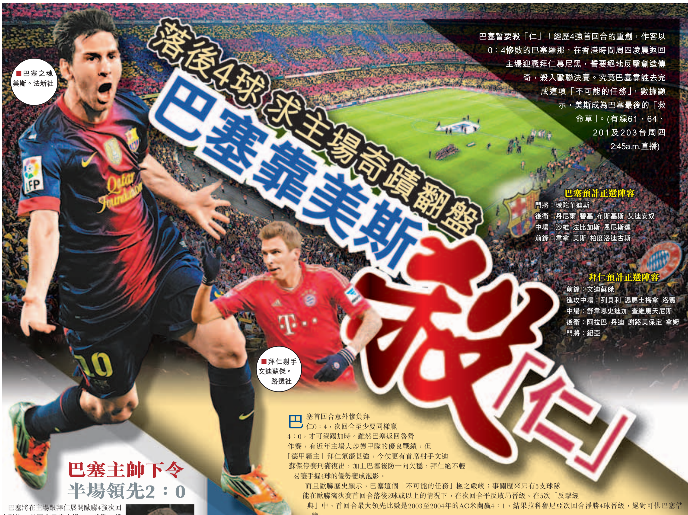
■巴塞之魂 美斯。法新社