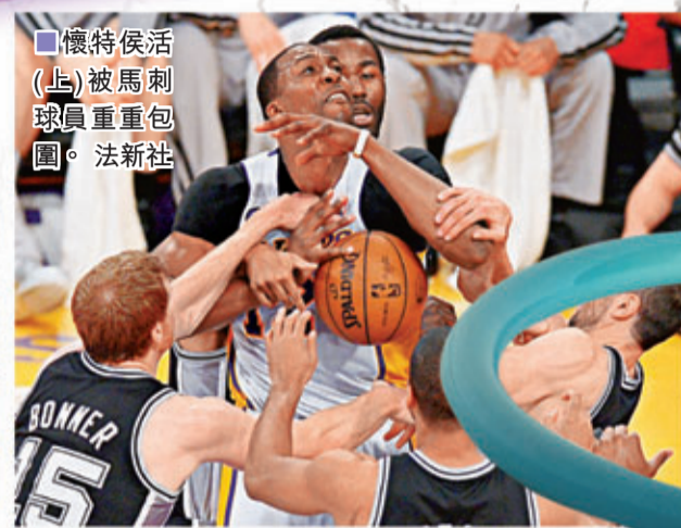
■懷特侯活(上)被馬刺球員重重包圍。法新社