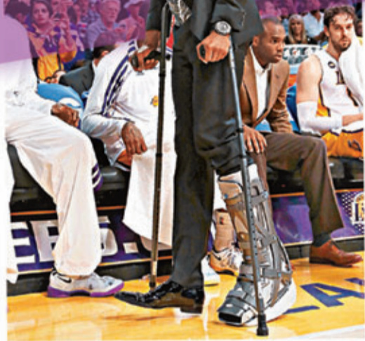
■高比拜仁一拐一拐離場。