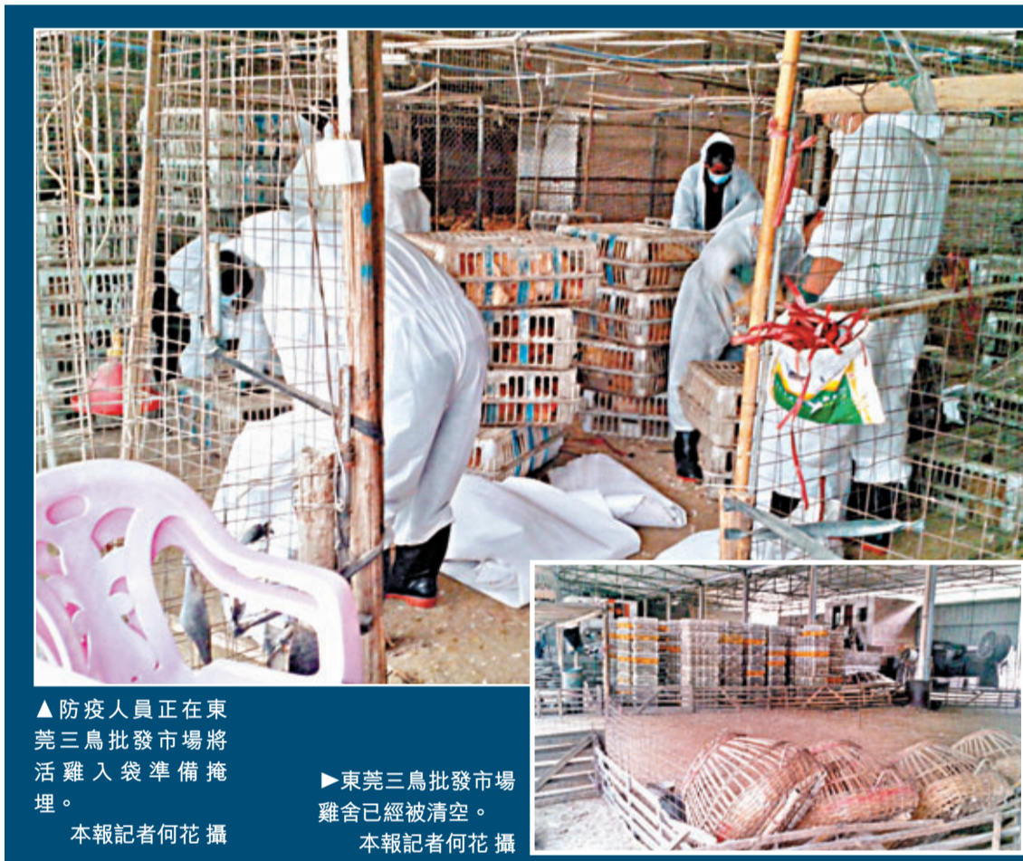
▲防疫人員正在東莞三鳥批發市場將活雞入袋準備掩埋。

東莞疾控專家提醒市民，要避免直接接觸家禽鳥類，接觸後要用洗手液和水徹底洗手，禽鳥類食品要徹底煮熟。若接觸過病死禽、候鳥或與發熱、肺炎病人接觸後自身出現發熱、咳嗽、酸痛等流感樣症狀時，應立即到正規醫療機構就診。