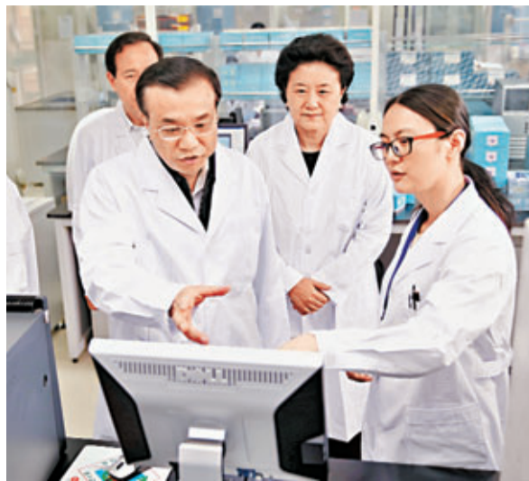
國務院總理李克強、副總理劉延東來到中國疾病預防控制中心病毒所考察病毒檢測、基因序列分析等工作，並與中心工作人員交流。