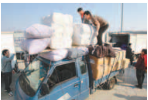
■韓國工人撤離時，把物資運到車上。

韓國政府前日宣布撤走所有滯留開城工業園區的175名韓方人員後，126人昨分批回國，餘下49人最遲明日離開。觀察家認為，留守園區的韓方人員安全撤出後，首爾當局可能對園區採取斷水斷電措施。