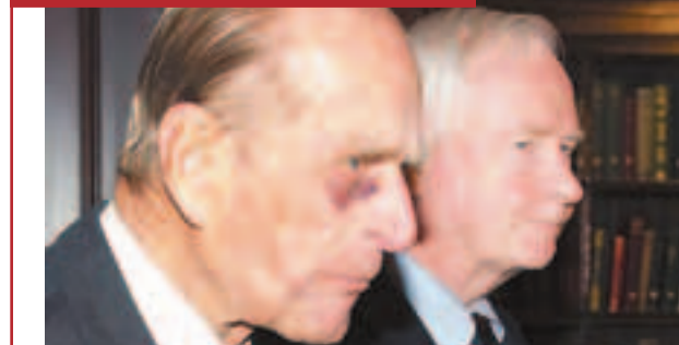
91歲的英國菲臘親王前日到訪加拿大多倫多出席授勳儀式時，被記者拍到右眼眼圍發黑，令外界擔憂其健康狀況。菲臘親王一向活躍王室活動，但近年健康明顯轉差，去年試過8個月內3度入院。