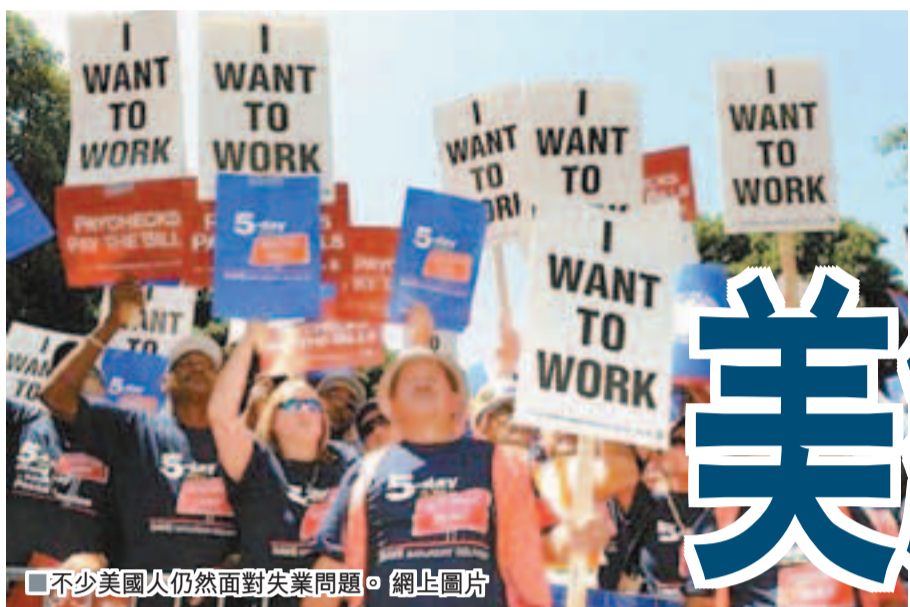
■不少美國人仍然面對失業問題。

美國前日公布今年首季國內生產總值(GDP)增長2.5%，較外界預期的3%增幅遜色，反映3月生效的聯邦自動削支影響浮面。由於削支機制持續數月甚至數年，國會預算辦公室早前已預計，本年美經濟增長減少近半個百分點，料經濟延至明年才有望提振。