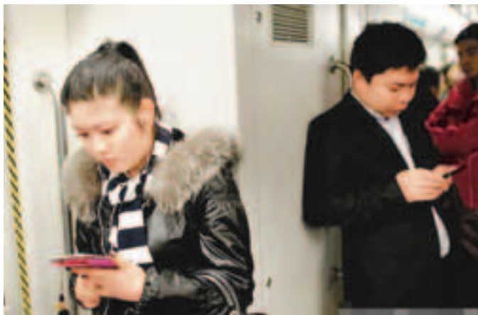
■在行駛的地鐵中打電話輻射度大增。

韓國環境部國立環境科學院日前完成的調查顯示，在地鐵或電梯內打手機，不僅帶來噪音，當事人所接收的電磁輻射更比平時高6至15倍。