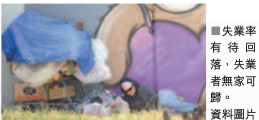
■失業率有待回落，失業者無家可歸。資料圖片

■法新社/路透社/彭博通訊社/《華盛頓郵報》/英國《金融時報》/《華爾街日報》/CNBC