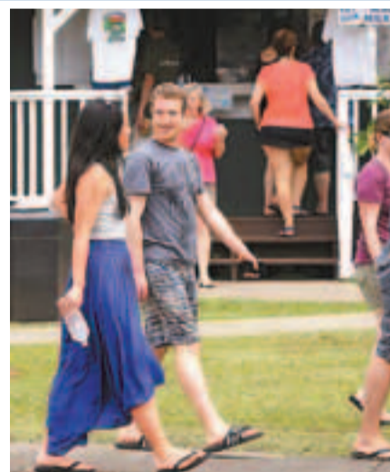
■朱仔早前與太太到外地度假。