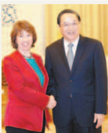
■俞正聲會見歐盟外交和安全政策高級代表阿什頓。中新社

此前，美國政府對於安倍內閣成員參拜靖國神社與安倍首相「不會屈服」的發言表示了不滿，美國國務院通過外交渠道，向日本政府提出了警告，要求安倍不要給東亞局勢帶來不穩定的因素。