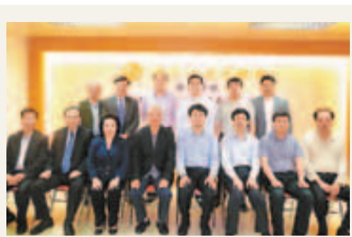
福建鄉會接待山東龍口市經濟開發區管理委員會訪問團。