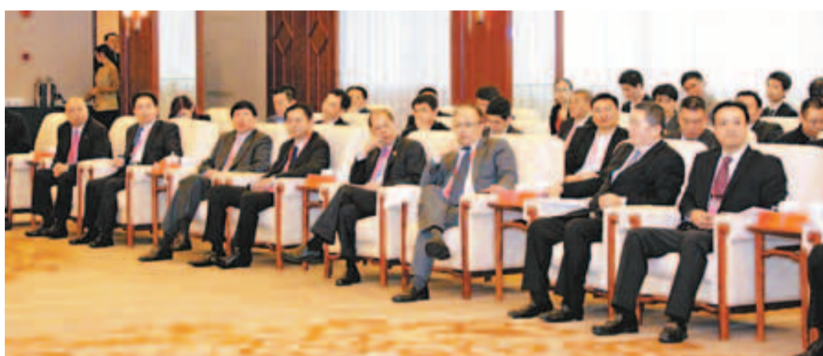
赴閩考察的部分僑商精英代表。

福建省委書記尤權對長期以來中國僑聯和僑商會給予福建的支持表示感謝。在簡要介紹福建經濟社會發展情況和投資環境後，尤權寄語僑商：無論身在何處，心繫祖國就好；無論能力大小，為家鄉貢獻就好；無論是否閩籍，來福建看看就好。他指出，華僑華人遍佈世界，始終心繫祖國、關心家鄉。改革開放以來，大家積極回鄉投資興業、興辦公益，牽線搭橋、獻智出力，成為推